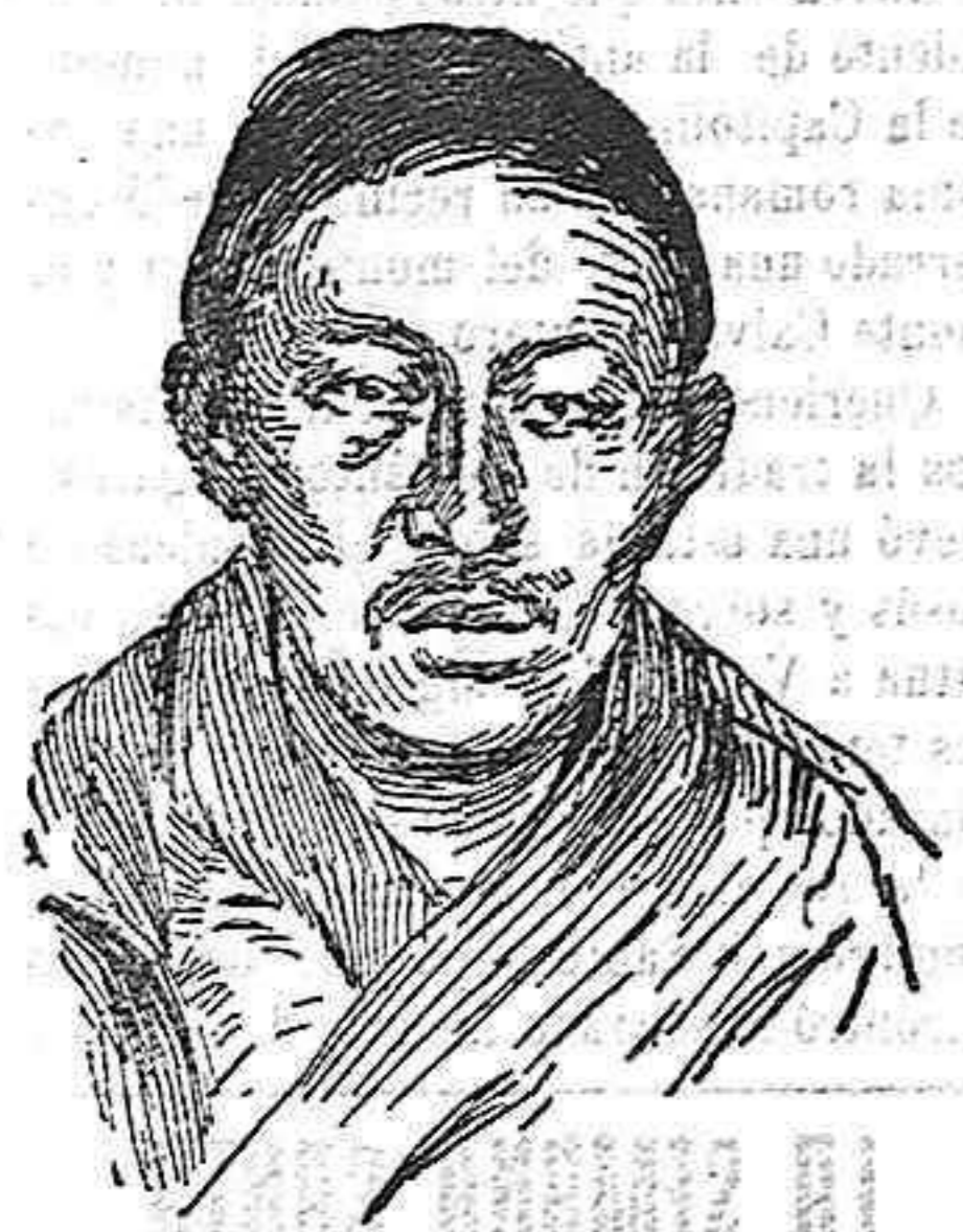
El Dalai Lama.

Cuando las tropas chinas que han tomado posesión del Thibet se aproximaron a Lassa, la ciudad santa, residencia del representante de Buda en la Tierra, el Dalai Lama huyó de su palacio como cualquier mortal, sin duda convencido de que su santidad no era suficiente es-