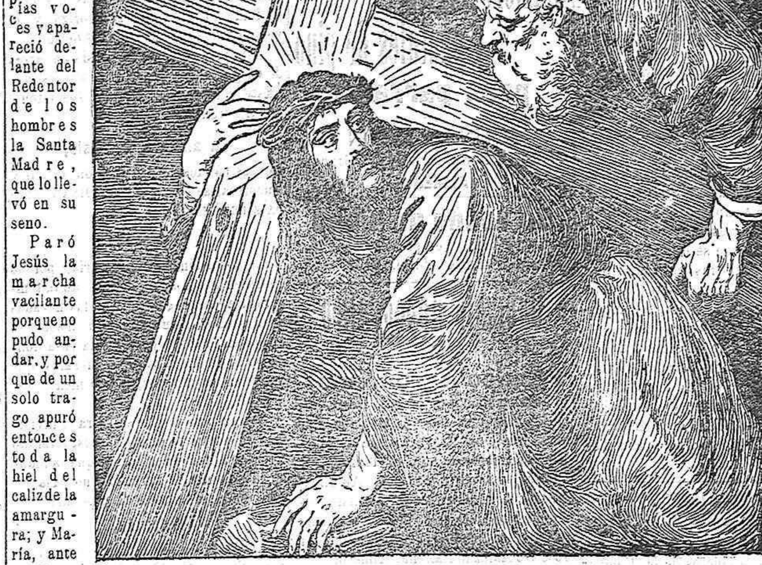
LA PRIMERA CAIDA DE JESÚS.

Paró Jesús la marcha vacilante porque no pudo andar y por que de un solo trago apuró entonces toda la hiel del caliz de la amargura; y María, ante aquel retablo vivo de la pena, no pudo llorar, ni hablar, ni andar, ni pudo dar salida á sus gemidos, cayendo toda aquélla deshecha tormenta de dolores sobre su angustiado corazón. Miró á Jesús con ansias infinitas y su amor lo reconoció que no los ojos. Era él y nadie otro podía ser Ninguno otro podía llevar la Cruz con tanta voluntad; nadie tan herido y tan resignado; y nadie tan lleno de vilipendios y tan mudo; nadie tan inocente y tan cercado de armas; nadie tan rodeado de inicuos enemigos y tan codicioso de dar por ellos la vida.