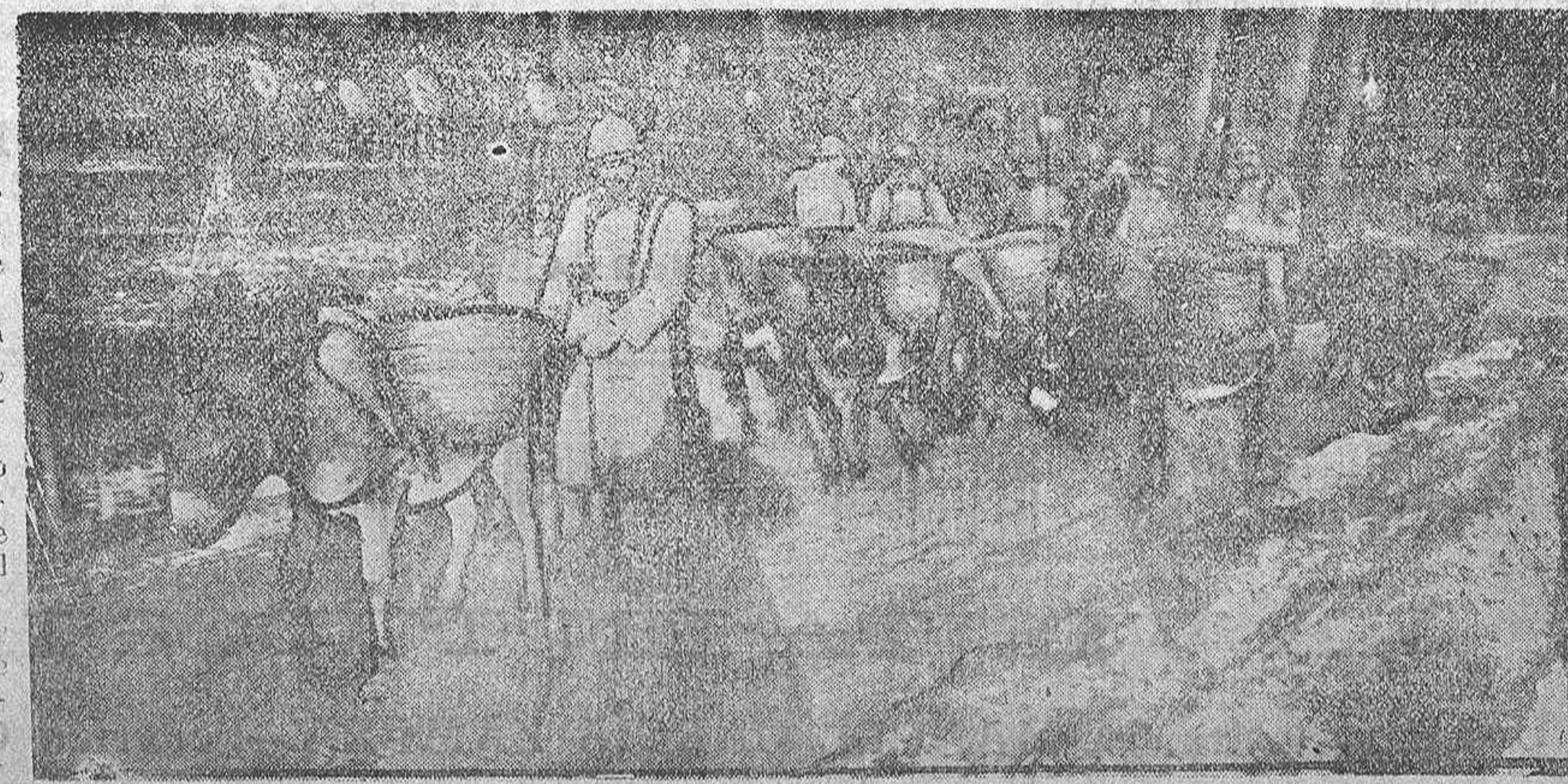
En el frente francés.--Un convoy de aprovisionamiento