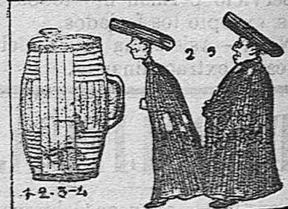
(La solución mañana).