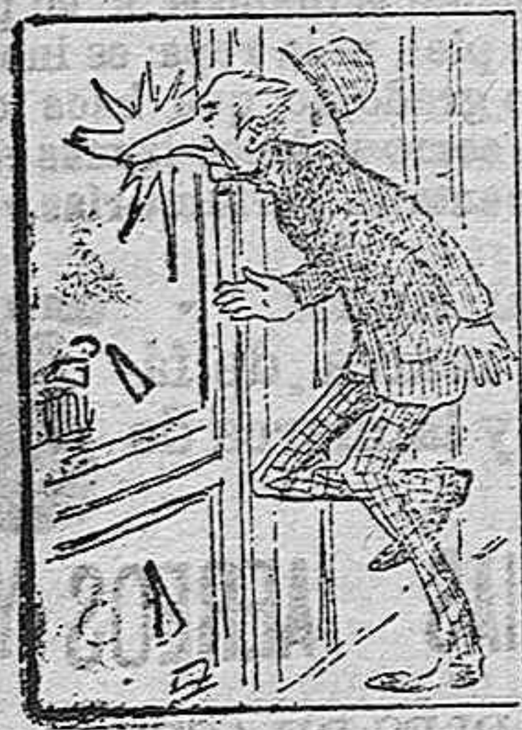
(La solución mañana).