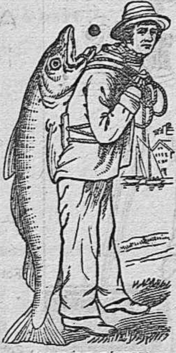
MARCA DE FABRICA