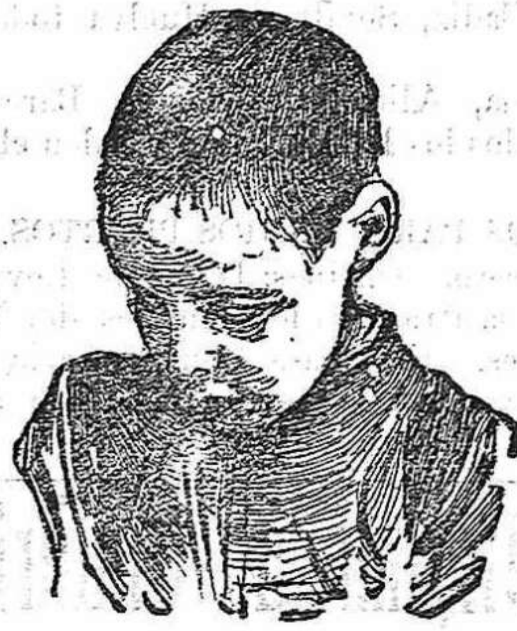
Después de usar el Capilho