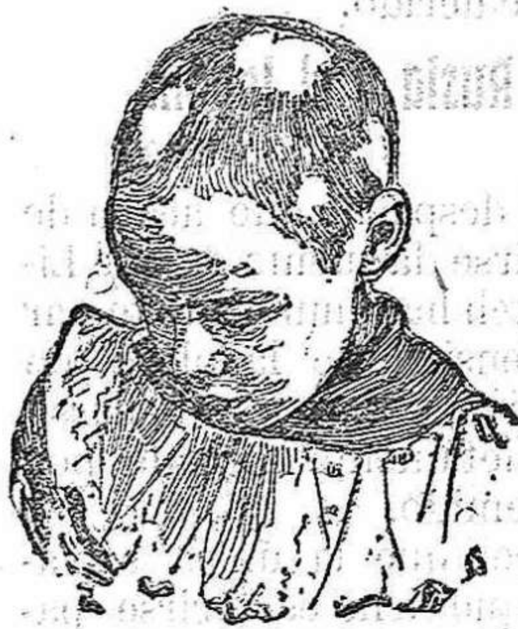
Antes de usar el Capilhol.