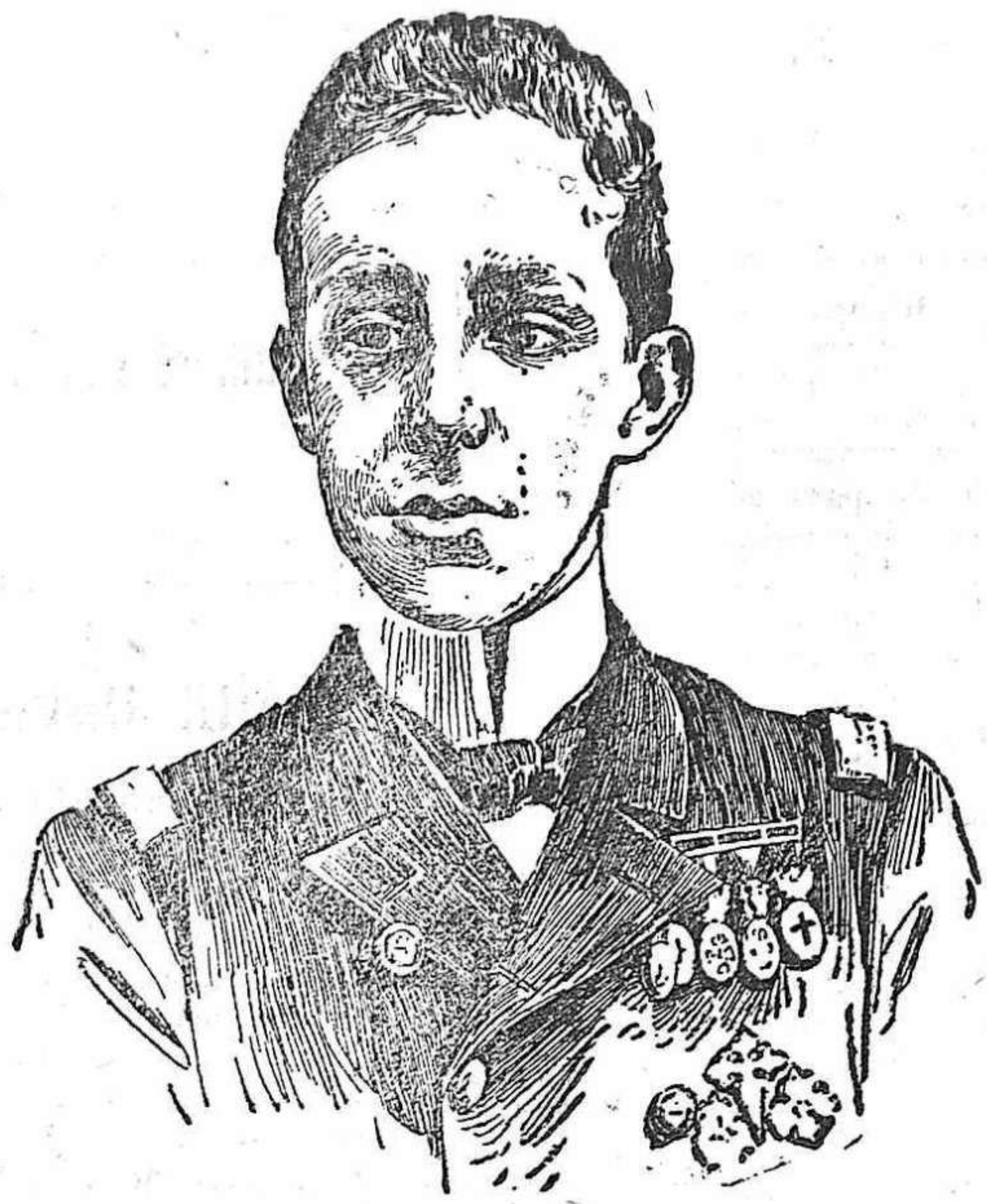
S. M. el Rey D. Alfonso XIII, que ha sido objeto de un infame atentado al salir del teatro de la Gran Opera, de París.