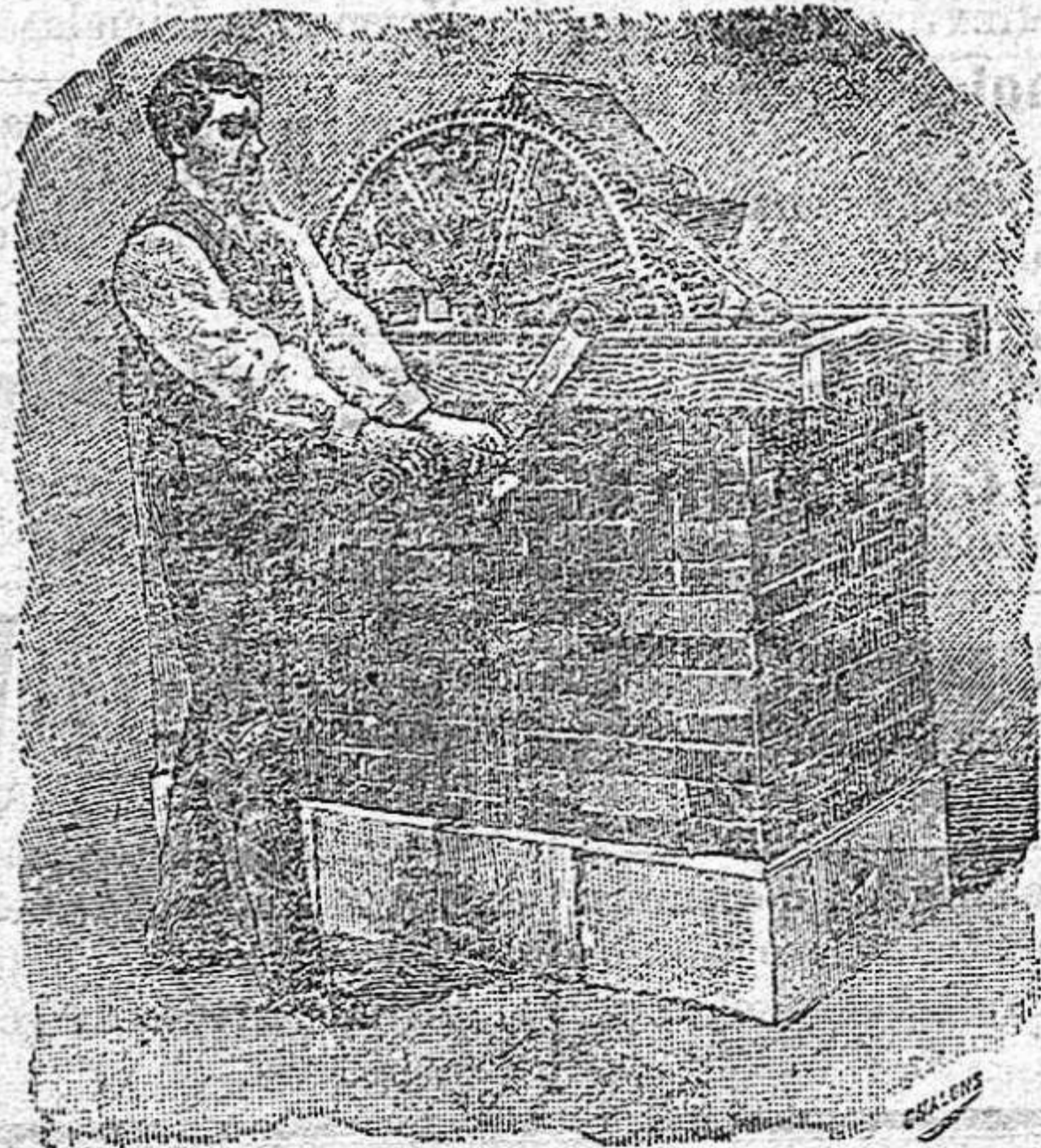
NORIA DEL NUMERO 1 AL 5.