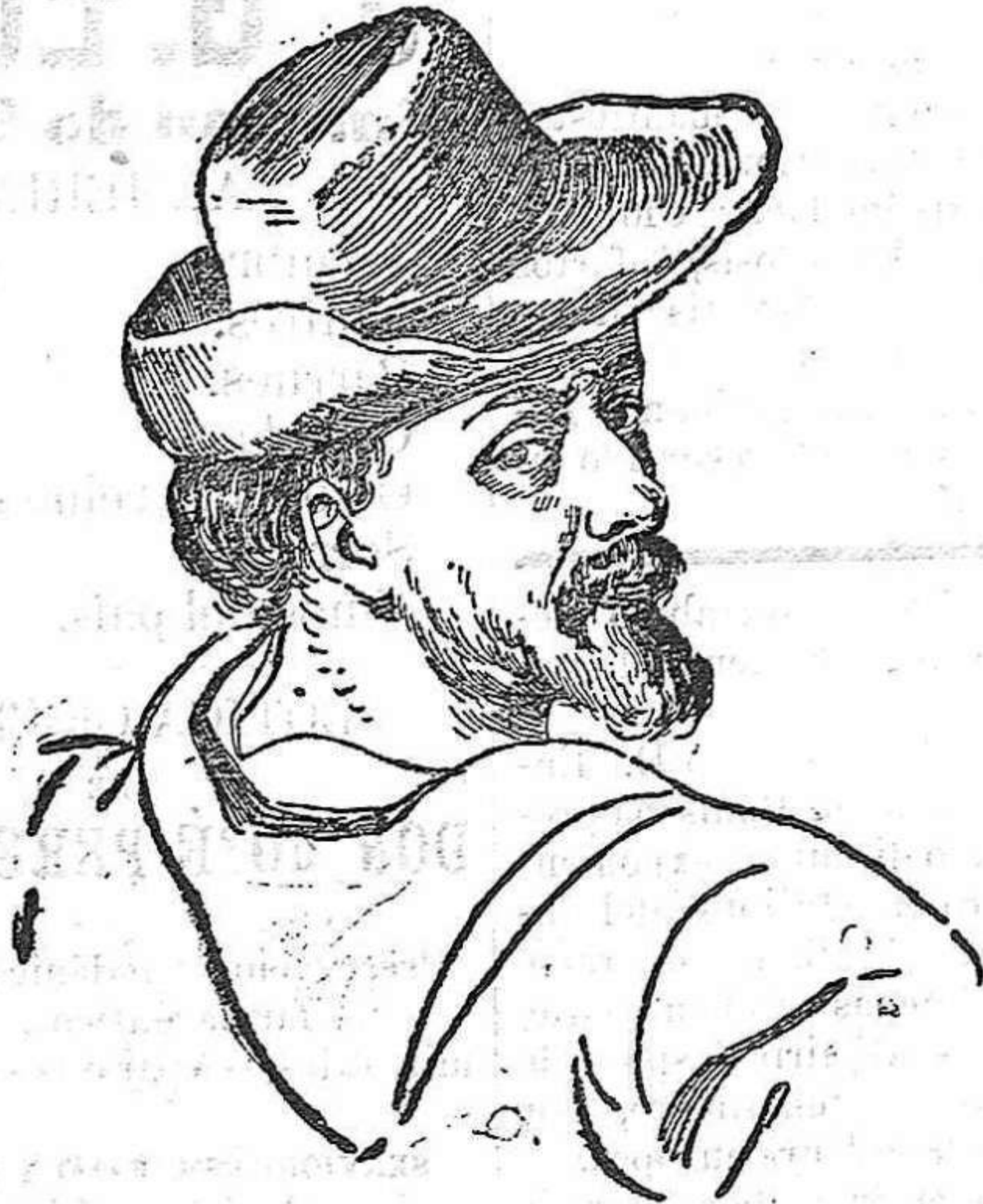
Miguel de Cervantes Saavedra.

soñados horizontes tan extensos, quedaron reducidos á la nada y á pesares más tristes, más intensos que á perder la fortuna y aún la vida; pues que es la libertad luz inmanente y oxígeno que anima al ser viviente; la dicha más preciada y más sentida. Pero Cervantes nó, jamás, desmaya; escápase una noche y en la playa en una cueva del jardín del rey Azán, se acoje con piadosa gente por él reunida sigilosamente