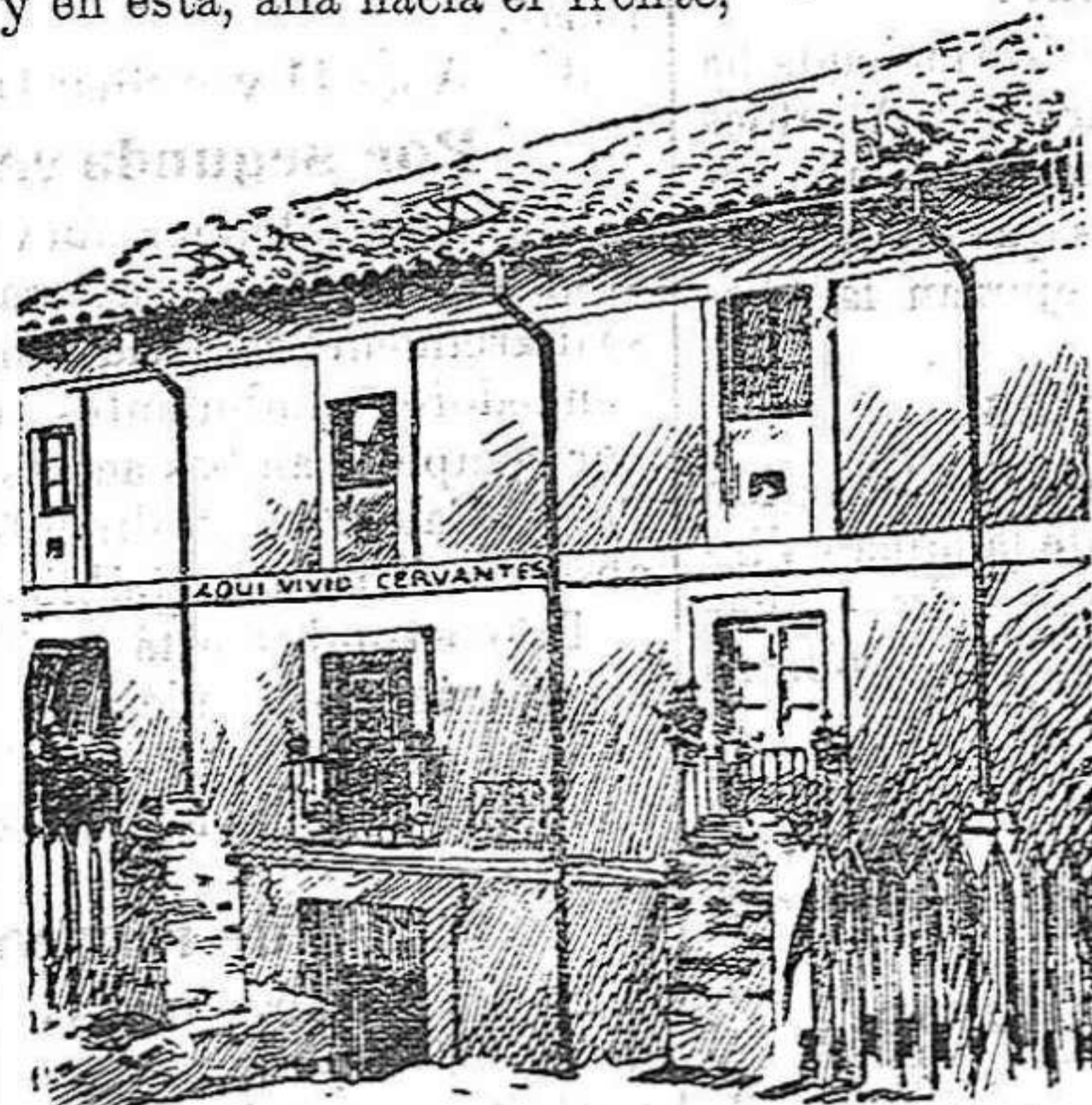
Casa de Cervantes en Valladolid.

Viajaba en la galera denominada «Sol», alta y velera, á Anftrite entregado gratamente en la plácida cuna de su popa, á un lado viendo costas africanas, á la derecha divisando á Europa, y en ésta, allá hácia el frente,