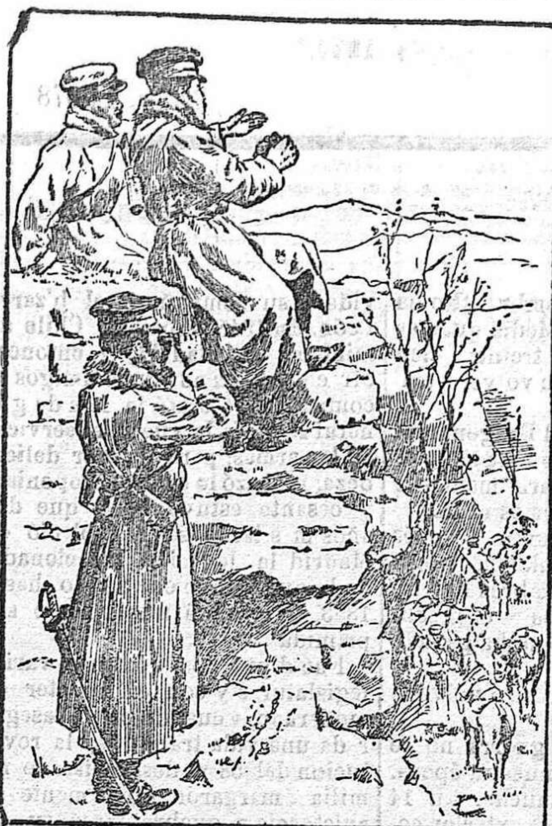
Avanzadas de oficiales japoneses reconociendo las posiciones enemigas.

en jefe del ejército ruso el veterano Linievitch. No faltan técnicos que, conociendo las buenas cualidades que este soldado posee como estratega, esperan una sorpresa; pero la opinión más general, basada en los continuos descalabros de los rusos, es que la nueva batalla constituirá una derrota más para el ejército moscovita.