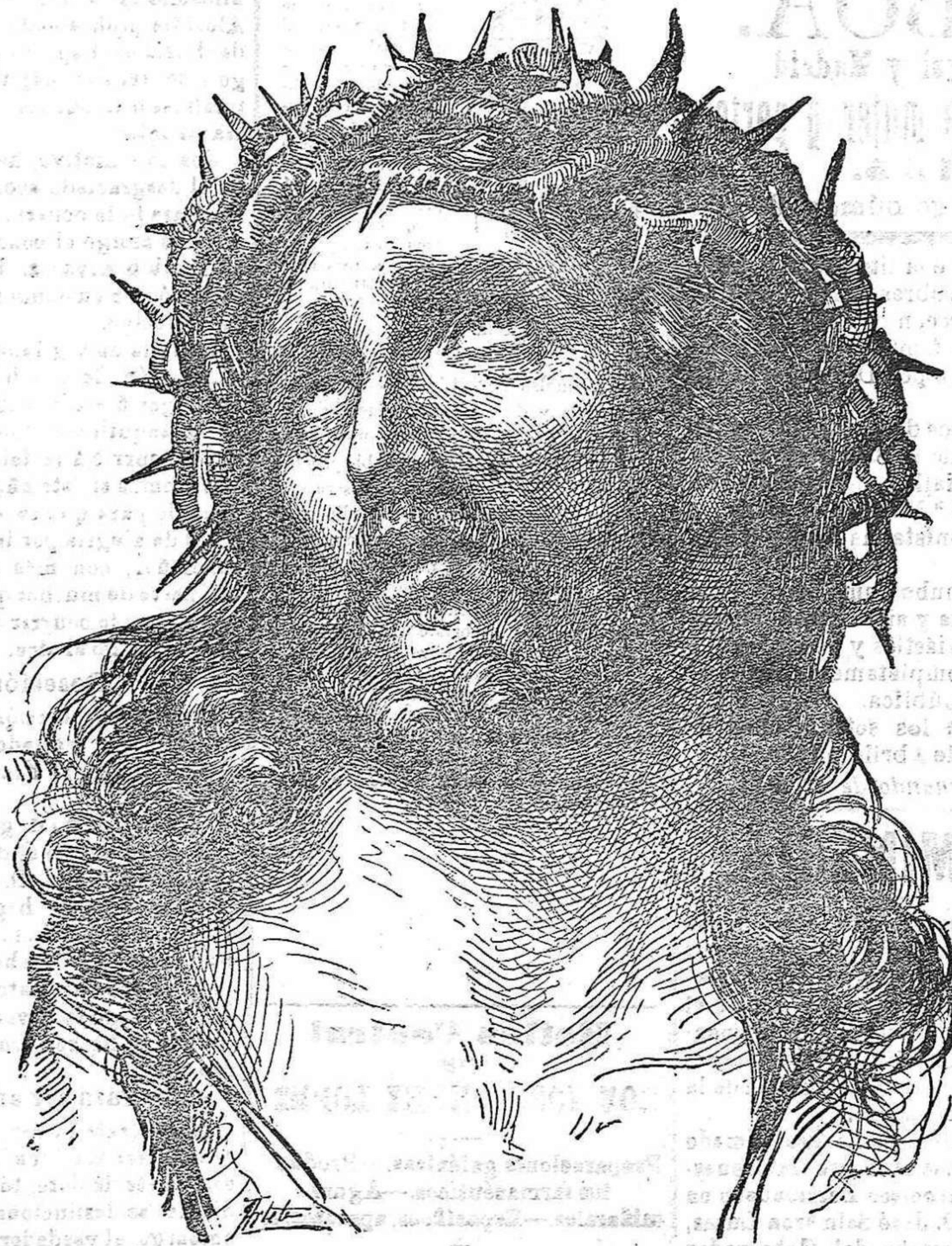
(CUADRO DE GUIDO RENU)

alumbró los misterios de aquel día un brillo extraño, virginal, prefuado, que un ángel le llamó luz de María.