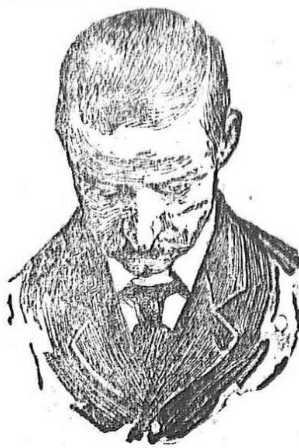
Después de usar el Capilho