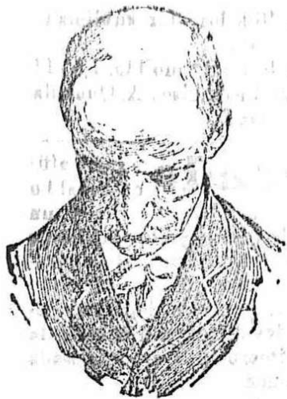
Antes de usar el Capilhol.