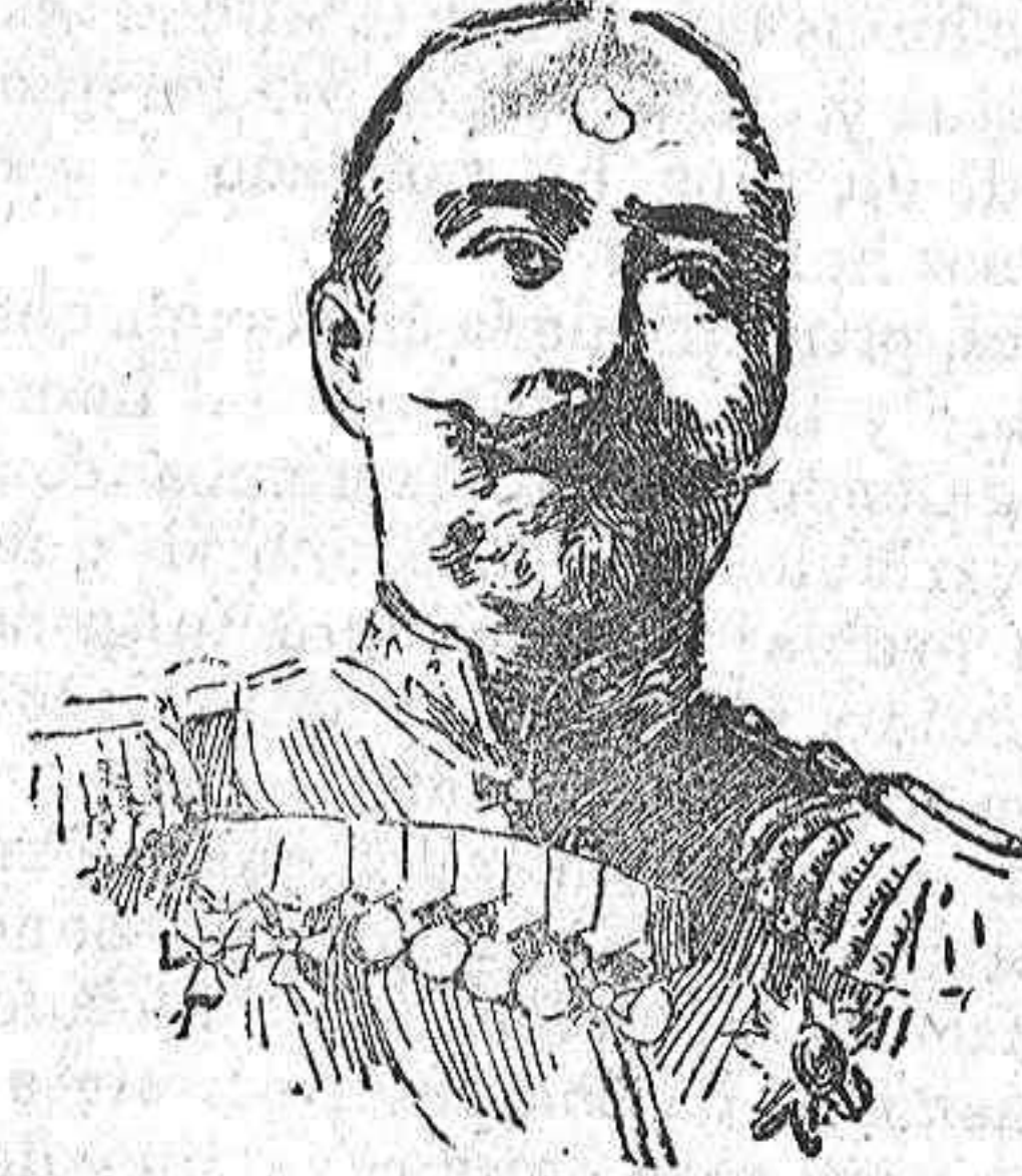
El general Stoessel, defensor por los rusos de Port-Arthur