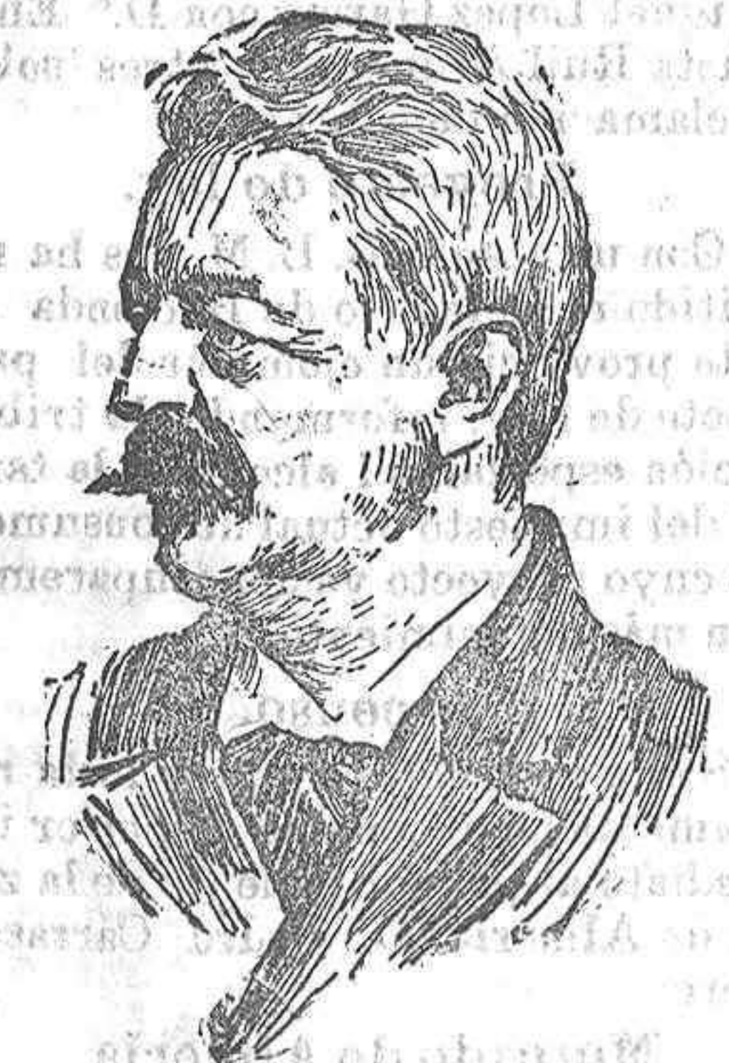
El Presidente de la Confederación Helvética.

4.ª En caso de que a juicio de la autoridad, se falte al orden ó decoro debido, ya profiriendo expresiones deshonestas, ya con actos que ofendan a la moral se procederá inmediatamente a la detención del culpa-