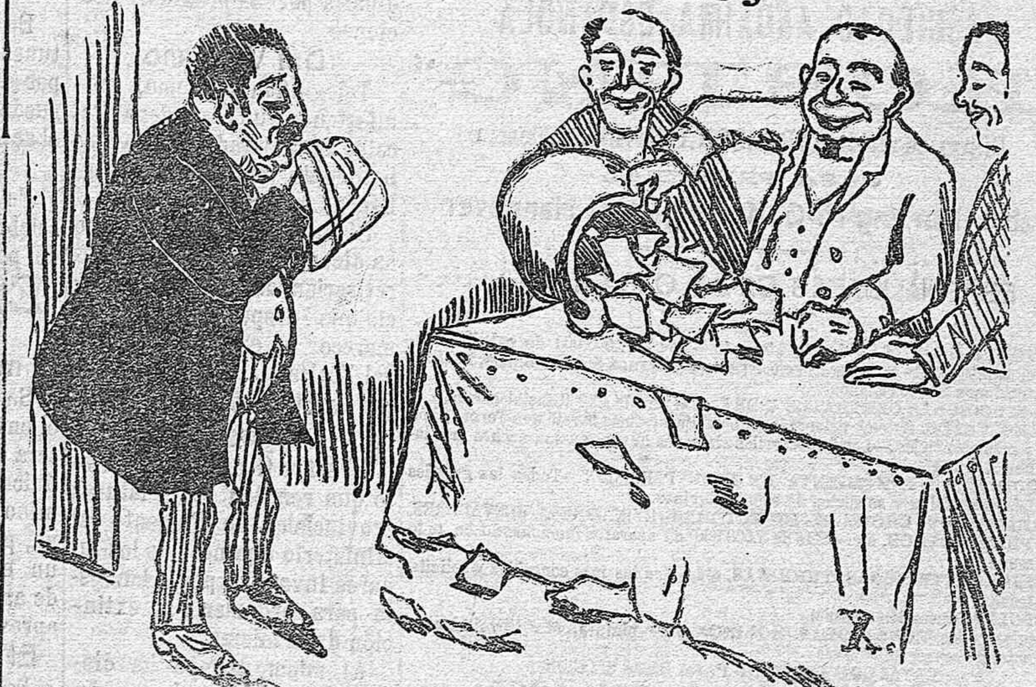
Don Regilio.—¡Volcarme á mí la olla! ¡Al único hijo de Almería! ¡Eso no es patriotismo!