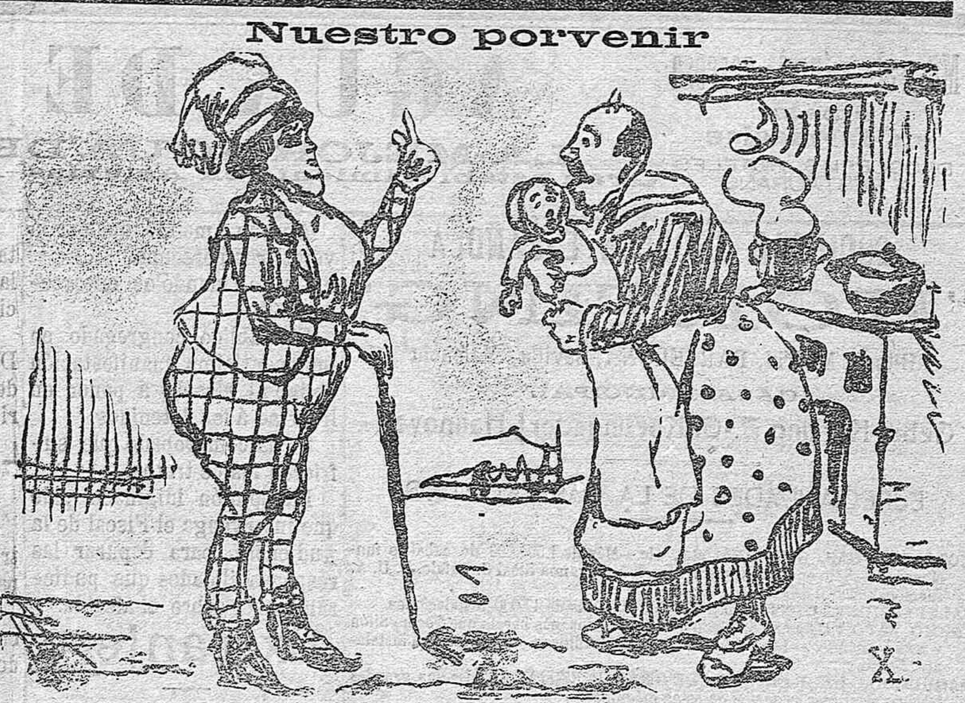
Por el cambio de la falda pantalón pronto, pronto llegaremos a esta hermosa situación.

El lavadero del Diezmo El lavadero del Diezmo continúa cerrado. ¿Por qué? Se ignora. Pero lo cierto es que las obras se terminaron hace más de un mes y que el Lavadero, sin embargo, no se ha abierto aún al servicio público. ¿Causas de Almería? Se ha gastado el Ayuntamiento varios miles de pesetas en esas obras, y ahora no se utilizan para nada. Caso como este de abandono, de desidia, de descuido, no se concibe en verdad. Lo peor de todo es que el vecindario de aquel paraje, harto de ver que el Lavadero, después de construido, no sirve ó por lo menos no se aprovecha para el objeto á que estaba destinado, vá hartándose de aguardar en vano á que sus puertas se abran; y tan solevitado se halla con este motivo, que no sería