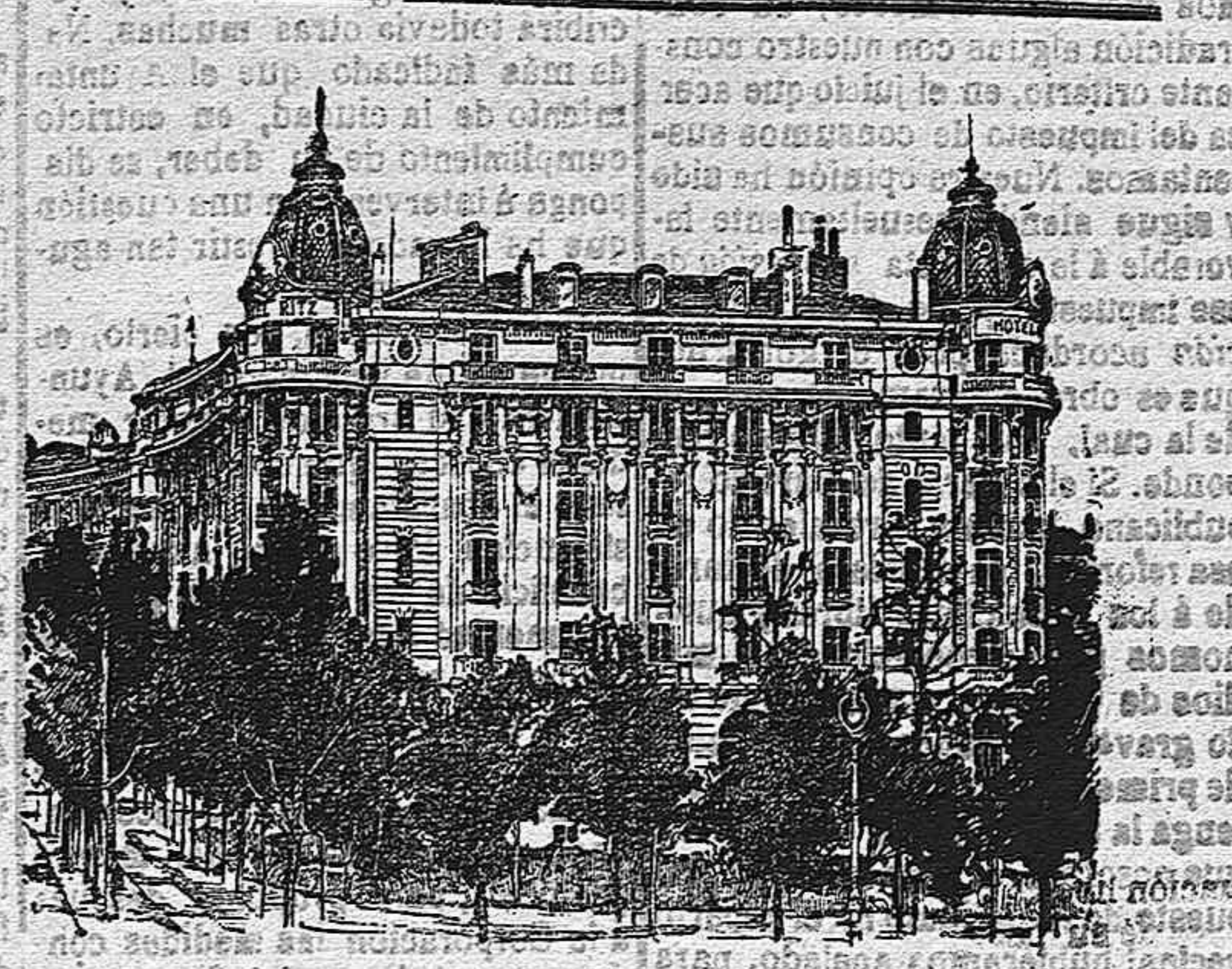
El Magnifico Hotel Nuevo de Madrid (EL HOTEL RITZ)

dejó decir en el salón de sesiones. El señor Guizarró desarrolló su anunciada interpelación financiera, y como siempre que se trata de estas cuestiones, fueron poco á poco desalojándose los ascaños, quedándose el orador solo con la mesa, y con el señor Rodríguez que dormitaba en el banco azul. SANCHIZ ORTIZ