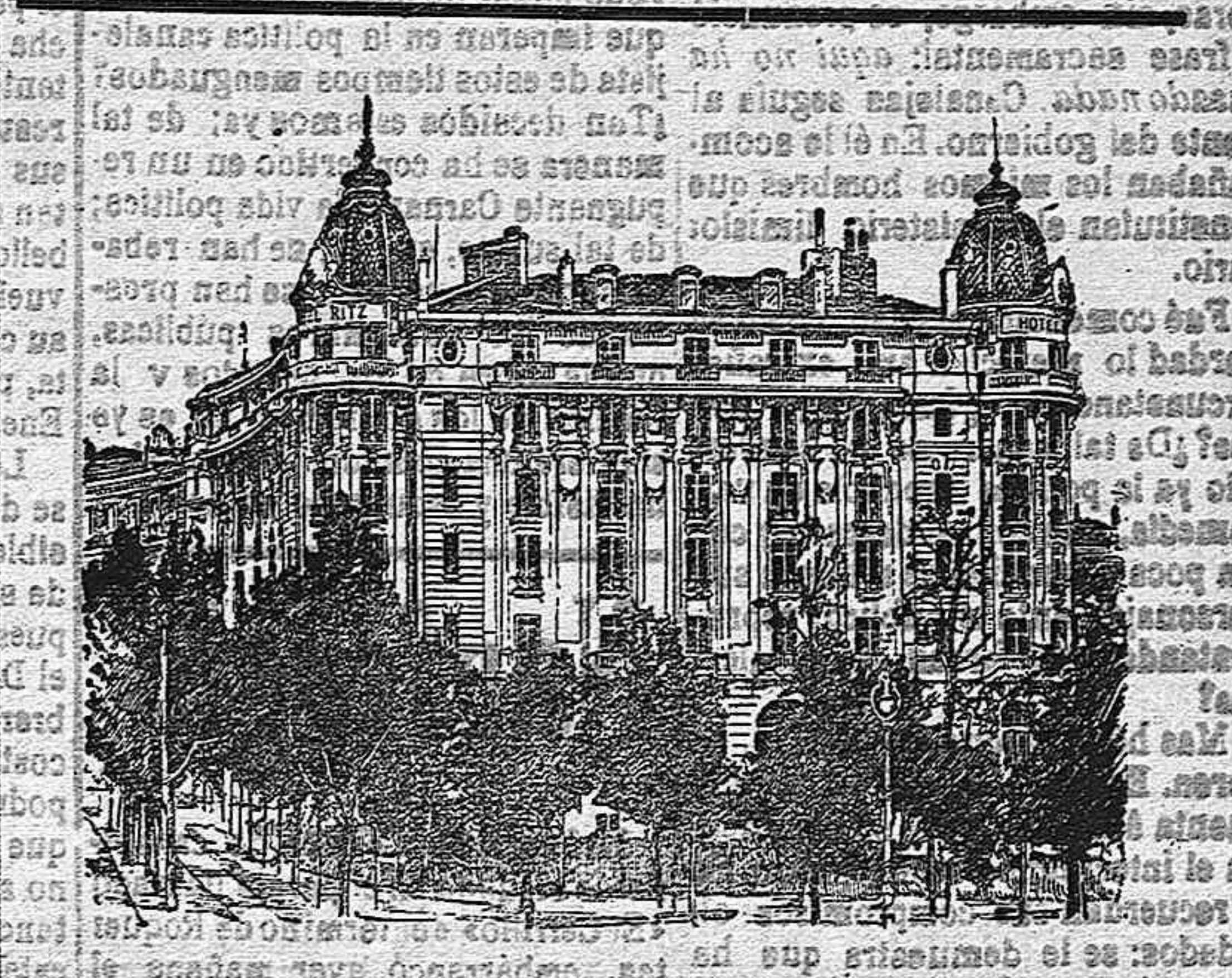
El Magnifico Hotel Nuevo de Madrid

Pudo haber algo terminado diciendo el presidente del Congreso pero no ha ocurrido nada.