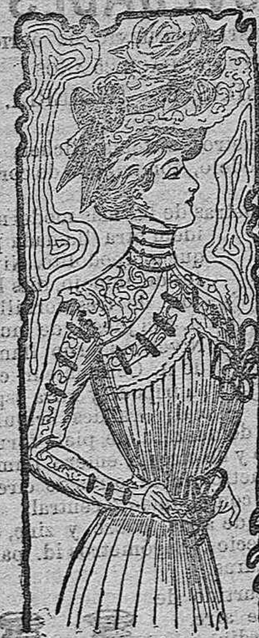
TRAJE PARA SEÑORITA.

El traje que representa nuestro dibujo, es de lana y está confeccionado á pliegues. Adorna el cuerpo un entredós «frivolité», y sobre él unas patas de terciopelo; este mismo adorno va colocado á lo largo de las mangas. Canesú de encaje «frivolité» sobre viso de terciopelo y adornado con cuatro cintas sujetas al lado derecho por otras tantas pequeñas hebillas. Falda acampanada.