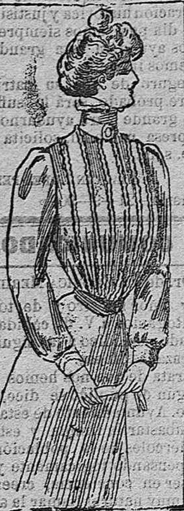
BUSA PARA SENORITA.

MODELOS EXCLUSIVOS PARA NUESTRAS LECTORAS.