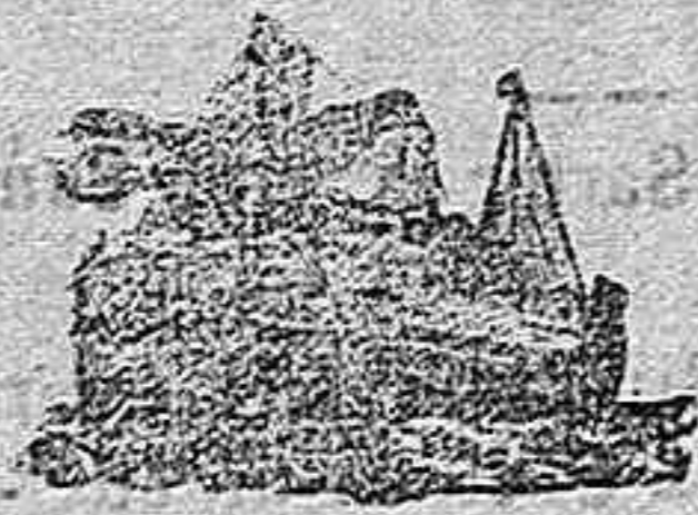
El comercio asat antiguo

Los pedidos han de hacerse precisamente en todo el mes de Diciembre.