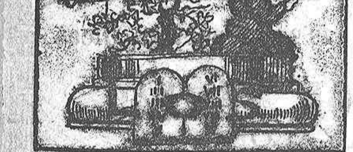
(La solución mañanera.)