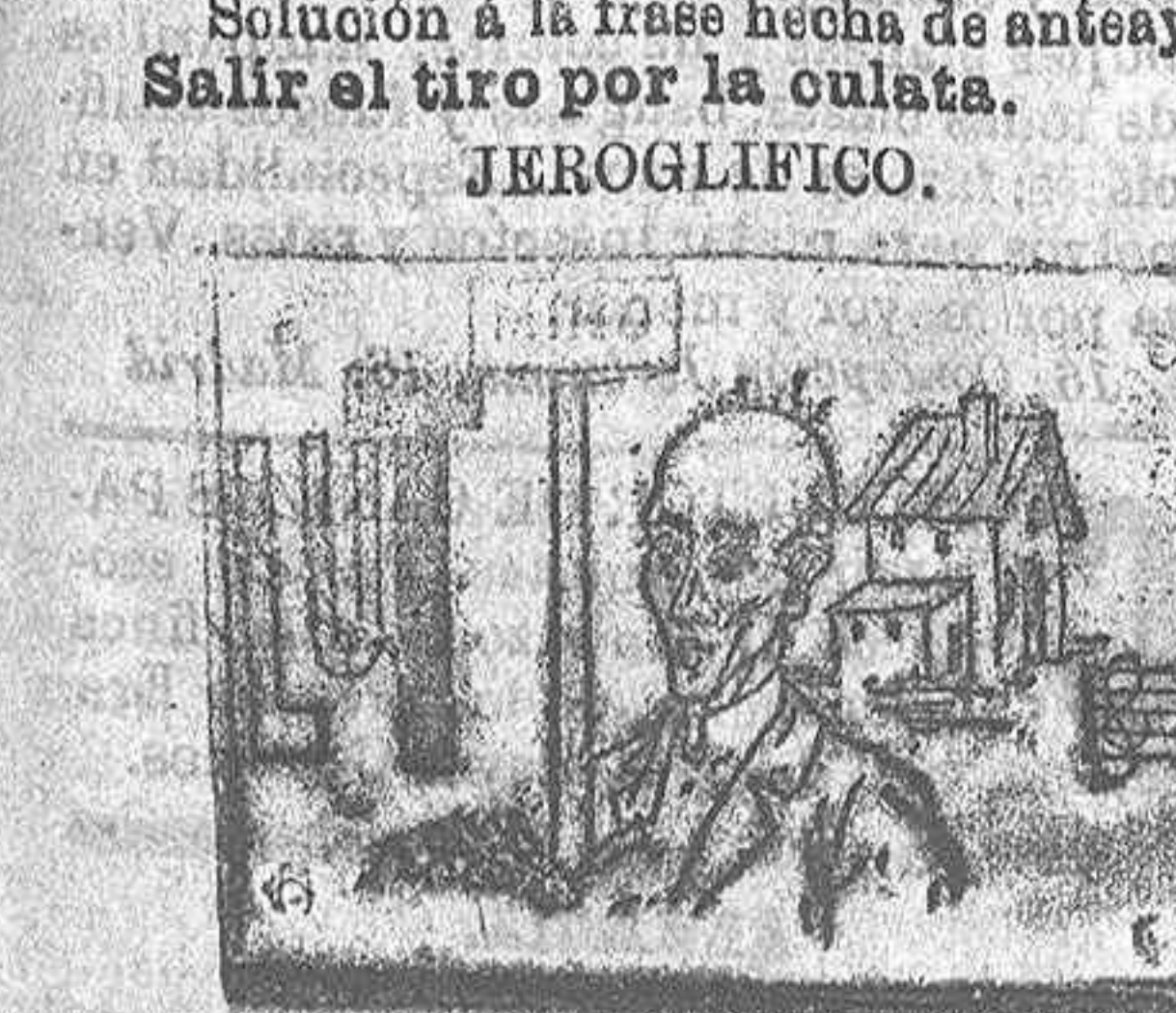
(La solución mañana.)