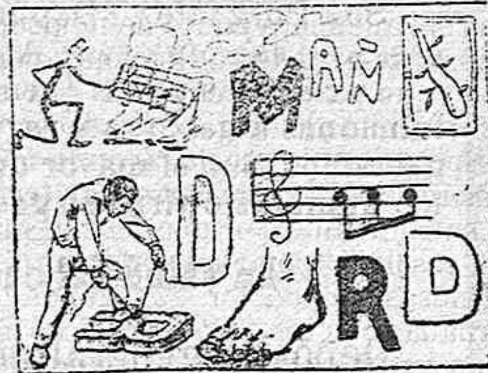
(La solución mañana.)