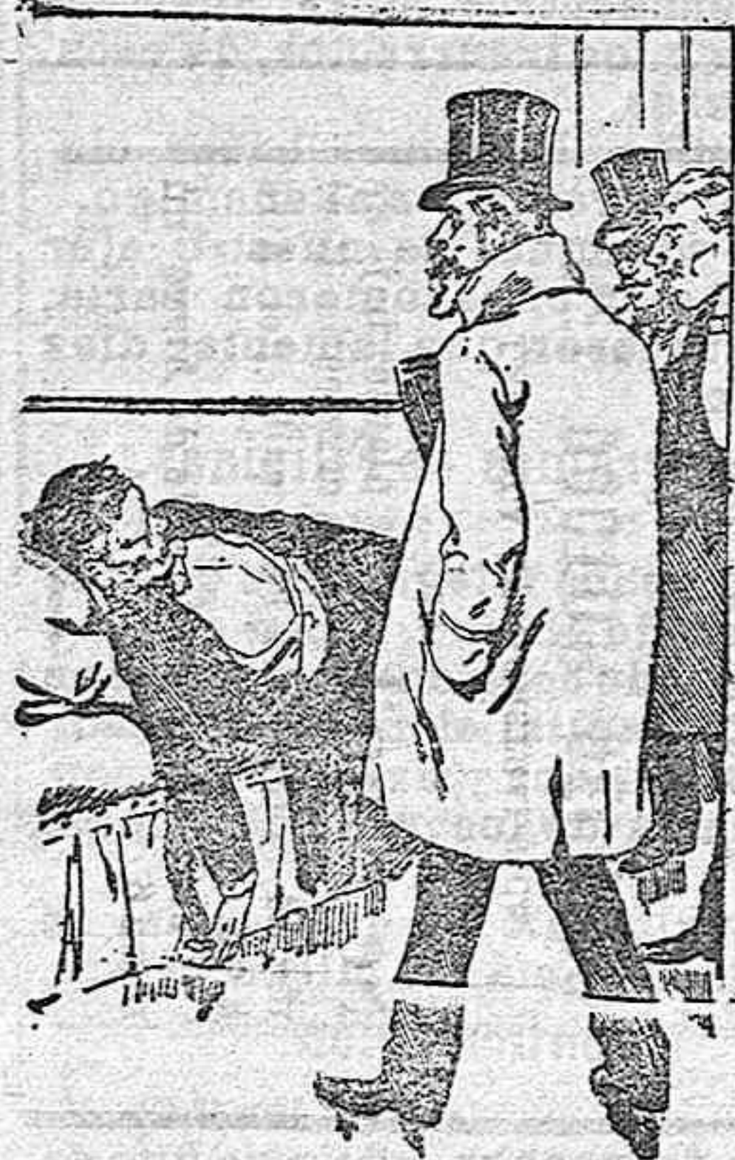
La última máscara.

Son las cuatro de la madrugada. En el rincón de una de las habitaciones del local donde se ha celebrado un baile de máscaras el domingo de Piñata, recostado sobre un diván, está un hombre joven, cuyo nombre y demás circunstancias se ignoran.