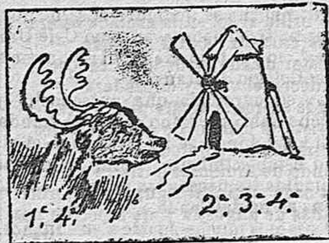
(La solución mañana.)