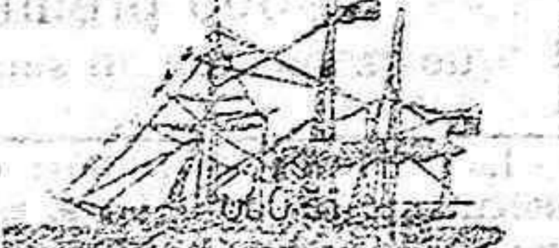
Vapor Garcia de Vinuesa

Saldrá de este puerto el dia 11 de Octubre para Cartagena, Alicante, Valencia, Barcelona, San Feliu de Guixols, Palamós, y Marsella.