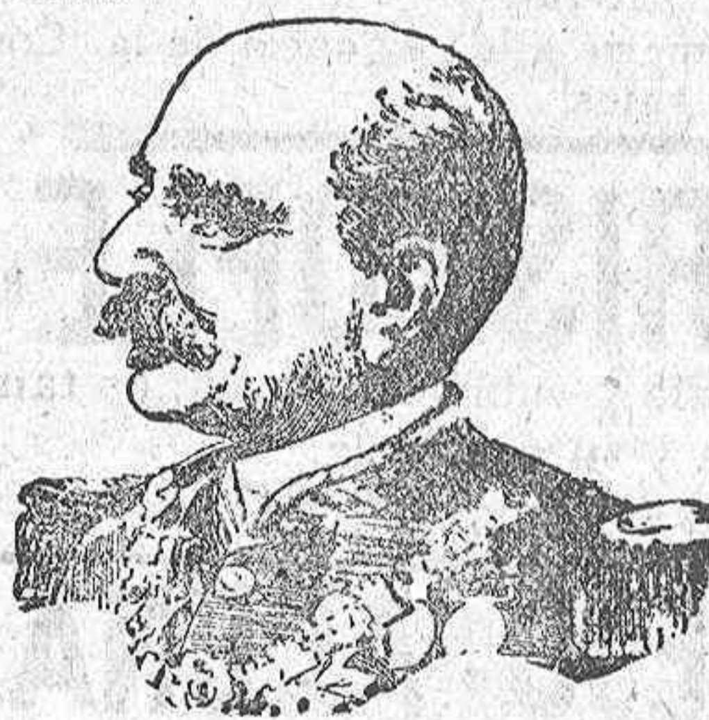
Retrato hecho hace unos diez años del general Primo de Rivera.

Hace poco tiempo, un año, que el difunto veterano marqués de Estella, tuvo ocasión de celebrar el septuagésimo tercero aniversario de su ingreso en el servicio militar.