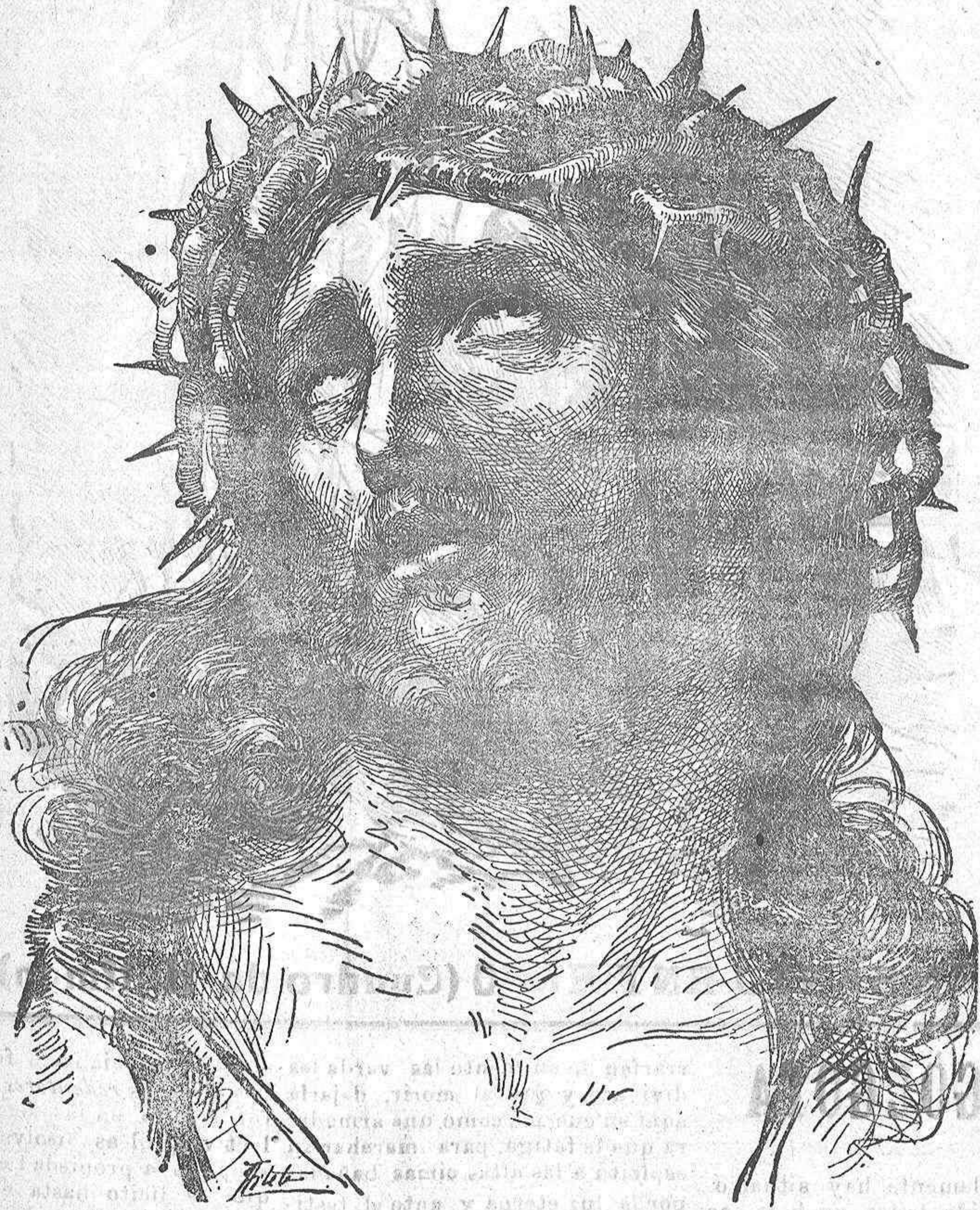
ECCE-HOMO (Cuadro de Guido Renu)

Penetramos en el templo: pensamos en esas frivolidades de la vida, entre las que solo puede decirse que se aperciben ambiciones, rencores, y odios en distintas y variadas formas; con diversos aspectos, ocultos, presentándose con el exterior más brillante, con el oropel más vistoso, frivolidades que cuestan muy caras pero que el mundo acepta alejado del idealismo de espíritu y sumergido por completo en un materialismo feroz que extremece y que espanta cuando alguno osa, sin preocupaciones de la mente, examinarlo.