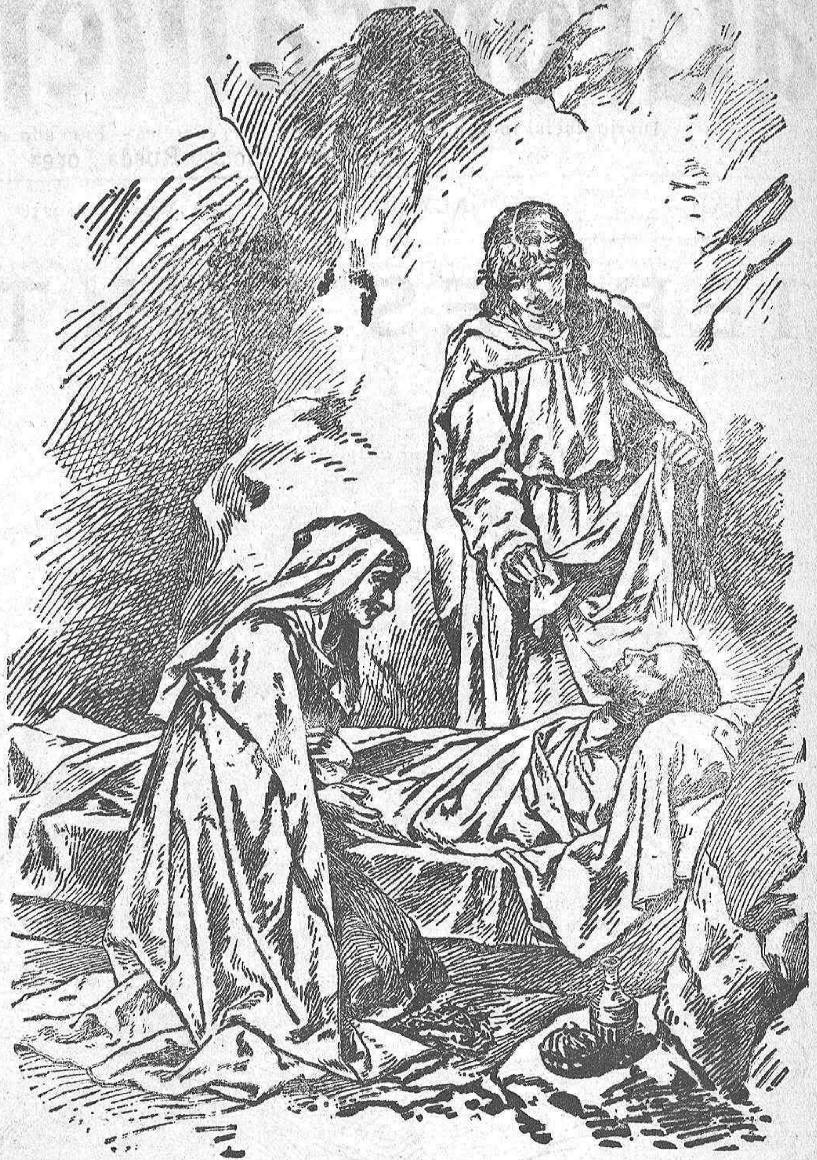
EL SANTO ENTIERRO (Cuadro de Hoffman)

La maldad ha triunfado y la Iglesia gime; la Iglesia se envuelve en el negro manto del dolor y llora cantando los salmos; entre las sombras de las tinieblas y en todas las ceremonias religiosas del día. Pero la luz surgirá poderosa, resplandeciente, cegando á todos y desde la obscuridades del Calvario llegaremos a los esplendores de la resurrección de Cristo, que es la resurrección a la vida de una idea y de un principio, tan poderoso, tan colosal y tan grande como que de su exacto cumplimiento estriba la felicidad humana.