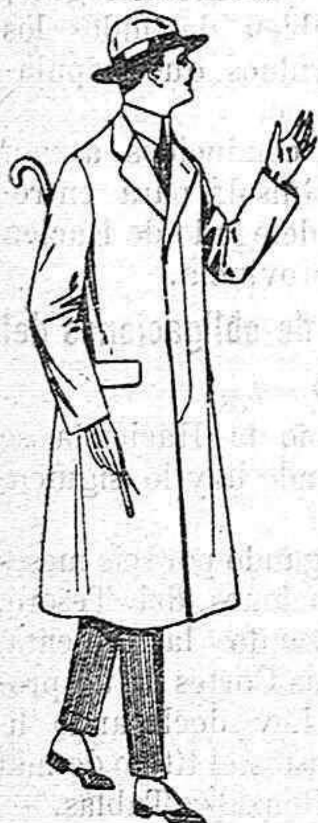
Gabanes de cheviot, melton, etc., con forro de seda o satén de ptas. 60 a 160