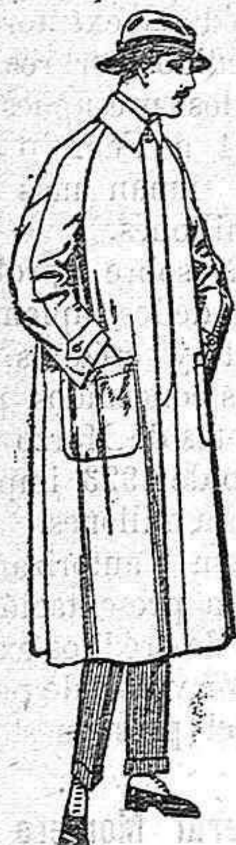
Impermeables forma gabán raglán de ptas. 40 a 170 El mismo modelo en caoutchou e, negro de pts. 70 a 90

Ropas confeccionadas para caballero, señora, niño y niña Especialidad en la medida