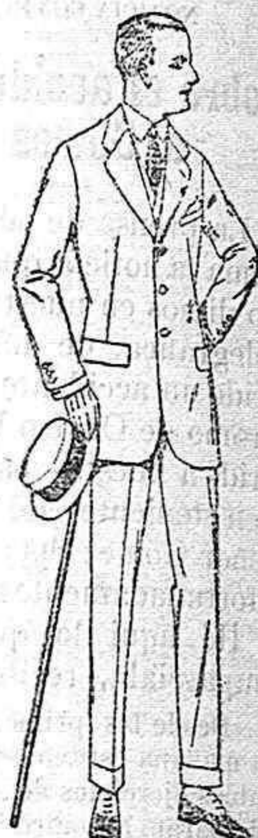
Trajes de lanilla, melton estambre, vicuña o jerga de ptas 29 a 135 Trajes de dril crudo, kaki o listado de pts 28 a 60