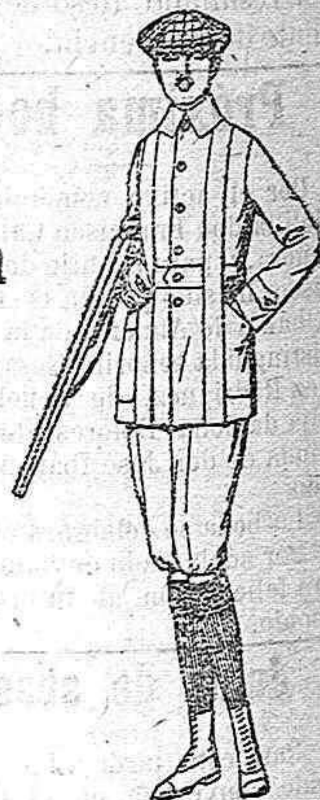
Cazadoras de dril crudo o kaki de ptas. 25 a 35 Pantalones cortos, para excursionistas de dril, beige o gris de ptas 10 a 18

Boás, camisería, géneros de punto, corbatería, guantería, sombrerería, zapatería, paraguas, bastones, sombrillas y artículos de viaje