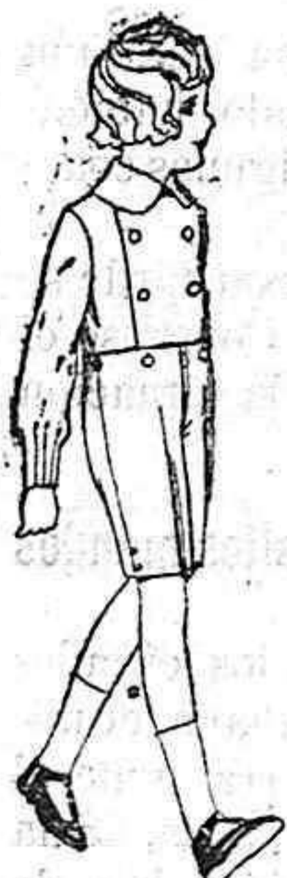
Trajes de vicuña o estambre azul, para niños de 3 a 7 años de pts 25 a 30 Los mismos de dril liso de ptas 10 a 15