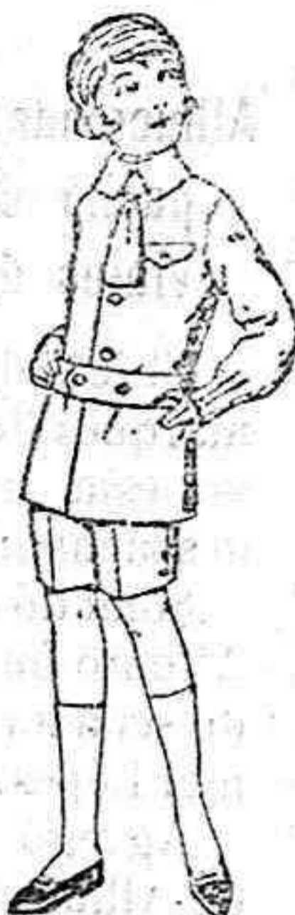
Trajes de lanilla melton, etc., para niños de 4 a 9 años de peso as 15 a 25. Los mismos de dril liso o listado de pts. 11 a 18