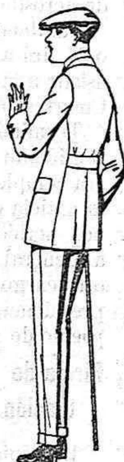
Trajes modelo Sport de lanilla, melton para jovenitos de 10 a 16 años pts 27 a 85. El mismo modelo en dril listado crudo o kaki de ptas. 25 a 42