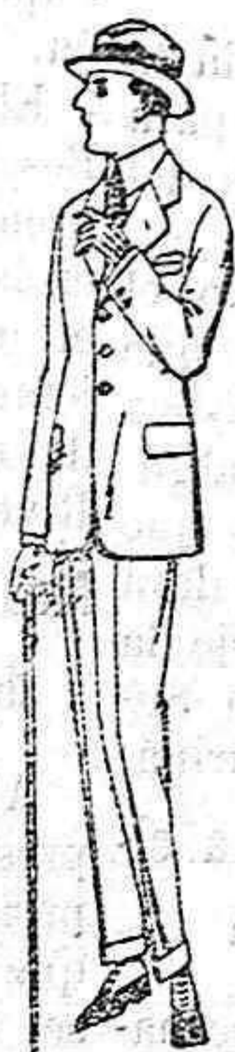
Trajes de lanilla, vicuña o estambre para jovencitos de 10 a 16 años de ptas. 26 a 80 Trajes de dril listado crudo o kaki de ptas. 23 a 40