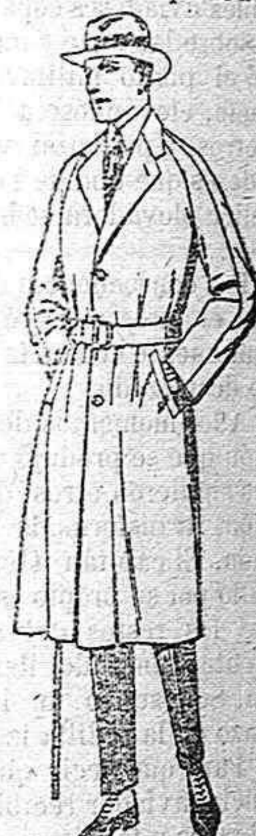
Gabanes de cheviot, cower melton, gabardina, etc. de ptas 80 a 185 Grandes existencias en géneros para gabanes a medida