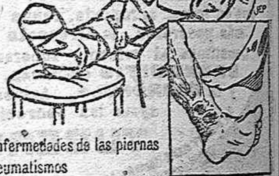
Enfermedades de las piernas, Reumatismos