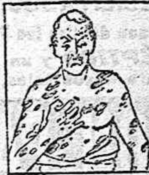
Acnes, Herpes, Eczemas, Psoriasis, Eritema

EL MEJOR remedio para EL PEOR catarro, Jarabe Orive. Precios 4'25 pesetas.