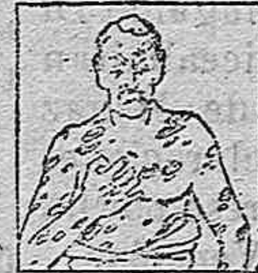
Acnes, Herpes, Eczemas, Psoriasis, Eritema