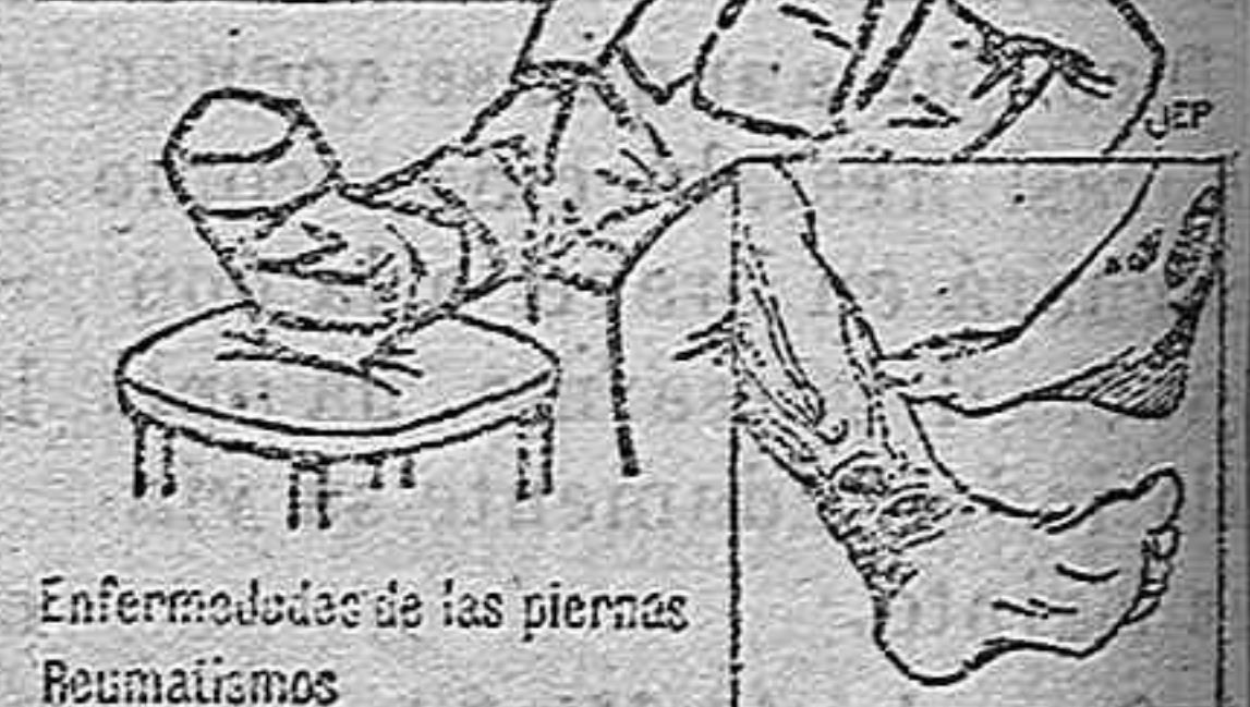
Enfermedades de las piernas, Reumatismos