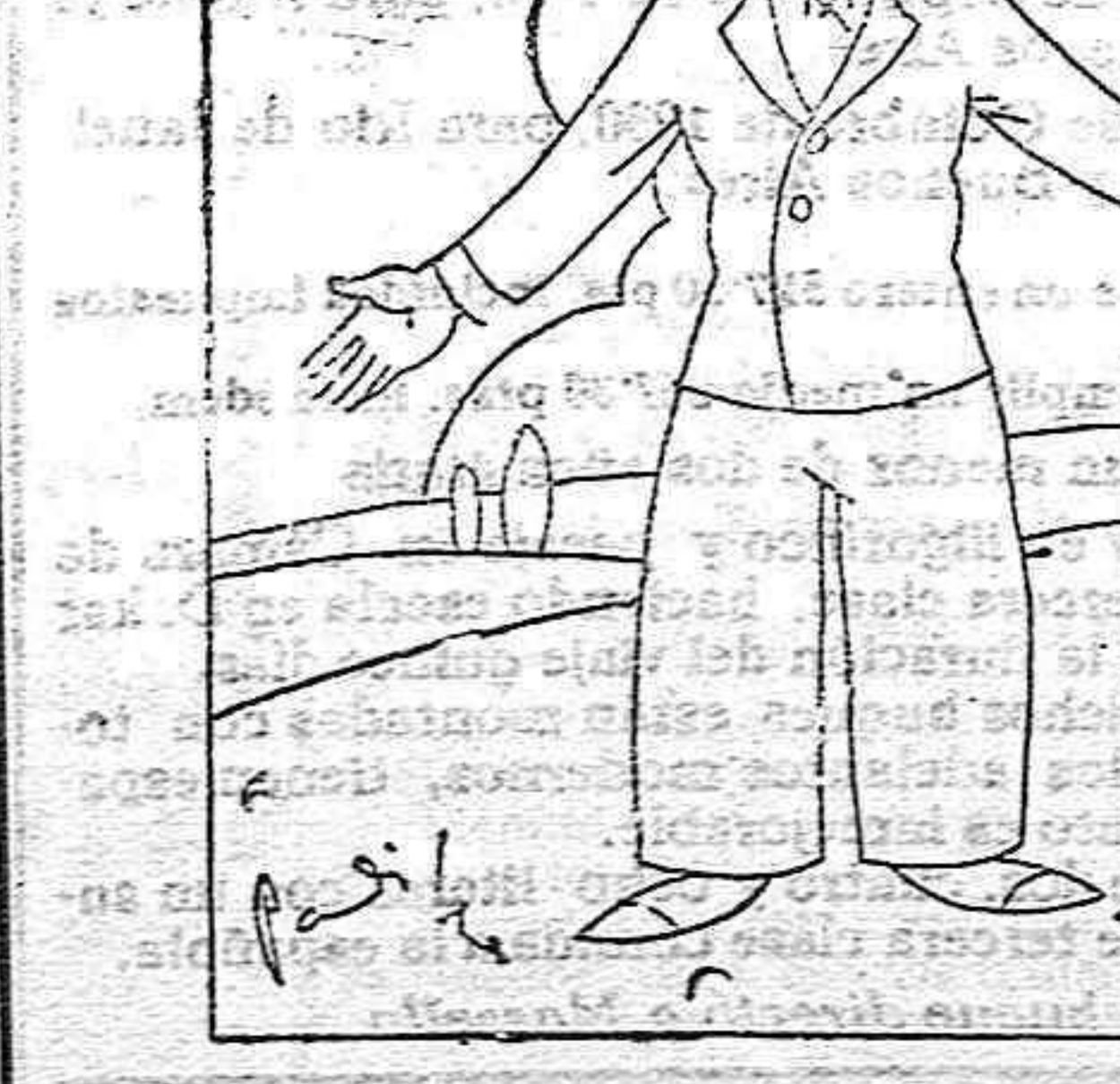
UN GRAN FINANCIERO

Y vi entonces en la joven bella y hermosa un rasgo de mujer que me hizo poner más fe en la siembra del ideal con la palabra o con la pluma en el corazón de la mujer española; me alargó