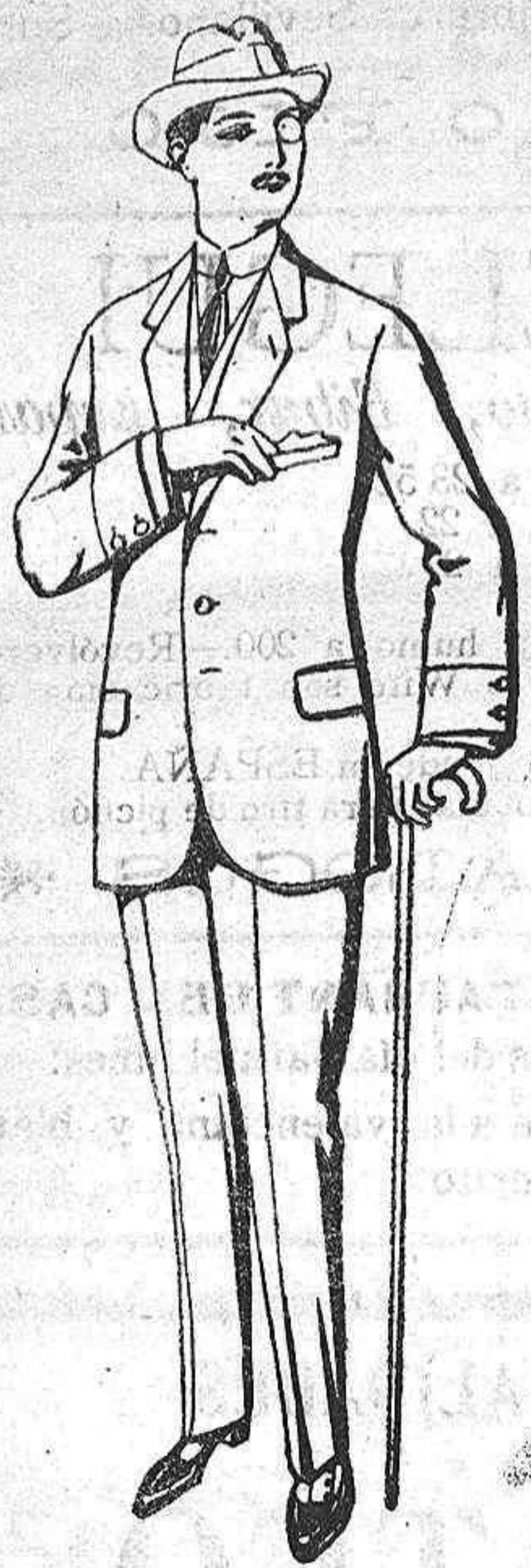
Traje de lanilla cheviot de pesetas 17/50 á 70