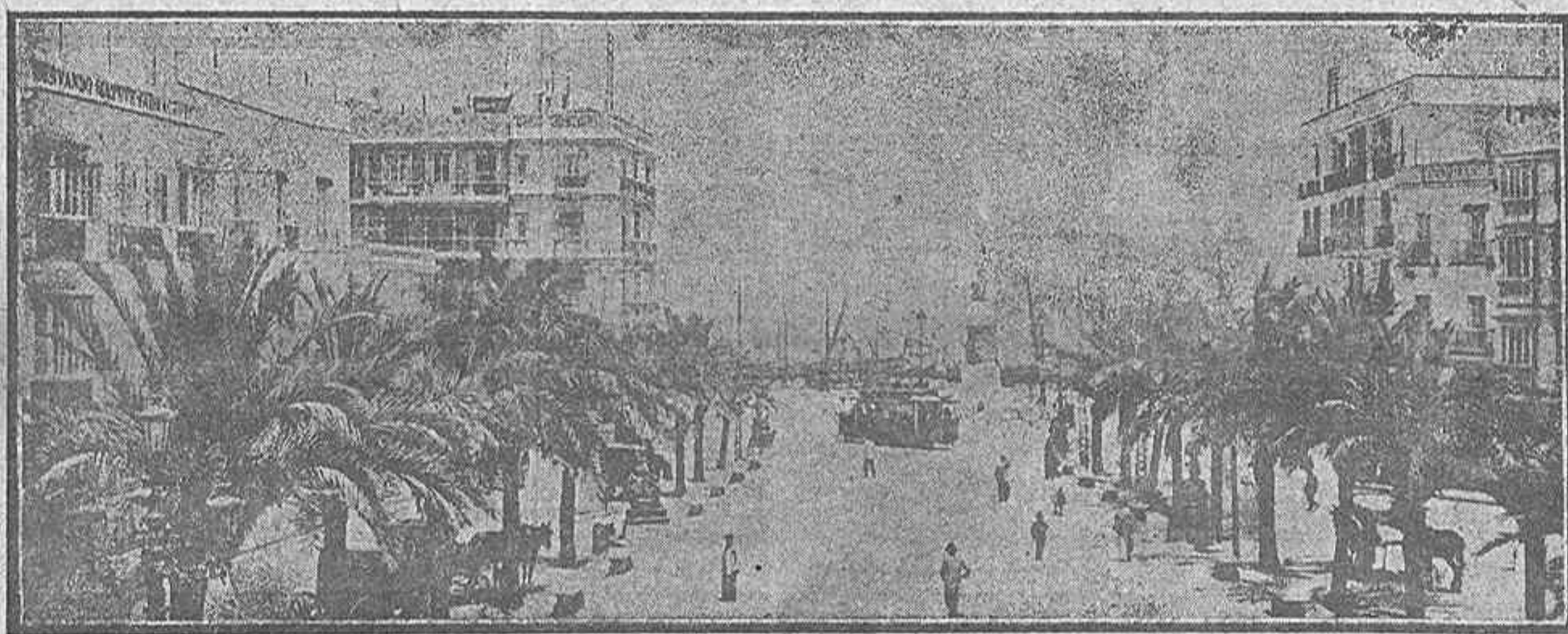
Cádiz : Plaza de Isabel II

Los pedidos de alguna consideración se llevan a domicilio sin recargo alguno.