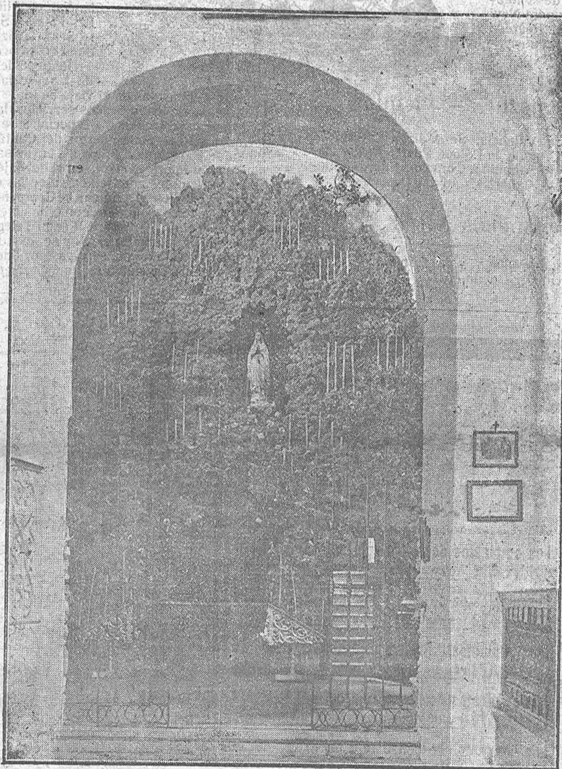
Puerto Real : Nuestra Señora de Lourdes

Teléfono 80 : No se devuelven originales.