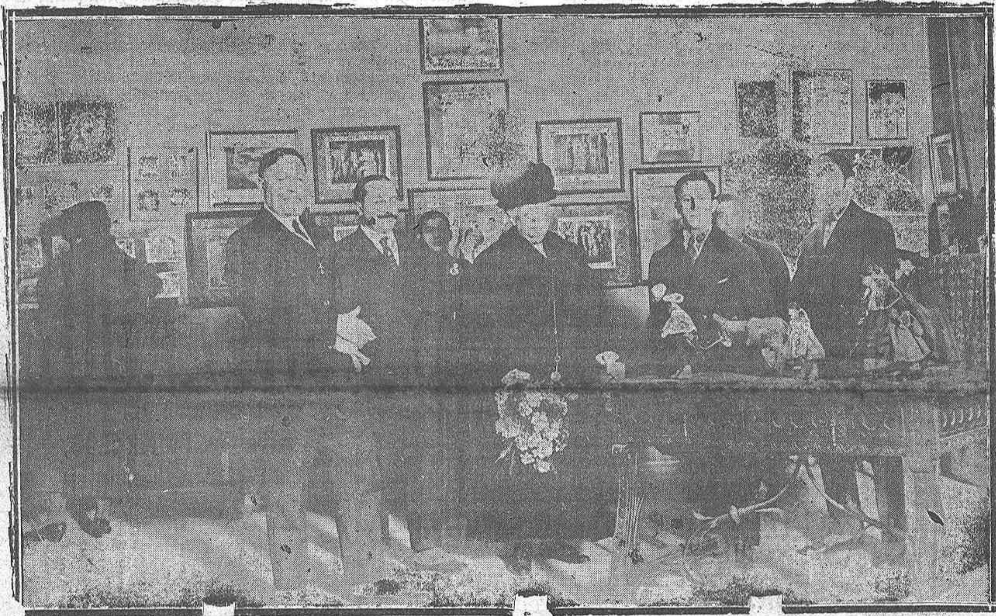
Su Alteza la Infanta Isabel visitando la Exposición de Humoristas.

Teléfono 80 : No se devuelven originales.