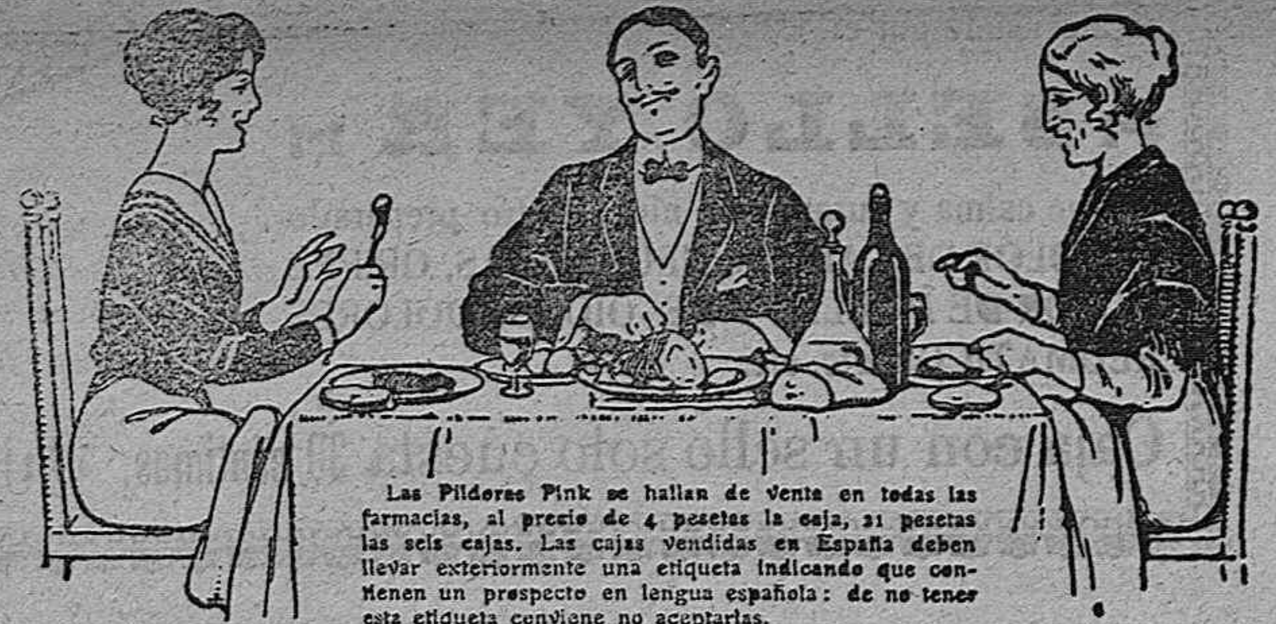
Las Píldoras Pink se hallan de venta en todas las farmacias, al precio de 4 pesetas la caja, 31 pesetas las seis cajas. Las cajas vendidas en España deben llevar exteriormente una etiqueta indicando que contienen un prospecto en lengua española: de no tener esta etiqueta conviene no aceptarlas.