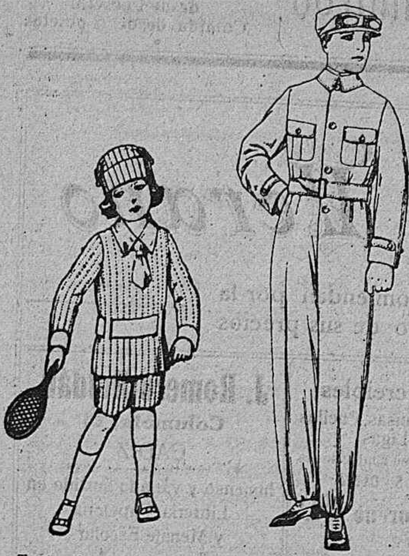
Trajes de punto blancos, con cenefas colores, de ptas. 10 a 11'50

Madrid, Barcelona, Alicante, Almería, Bilbao, Cádiz, Cartagena, Gijón, Granada, Málaga, Palma de Mallorca, Santander, Sevilla, Valencia, Valladolid, Zaragoza.