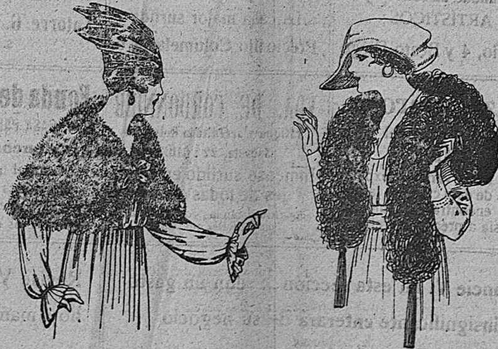
Capelinas de marabú adornadas, con cinta y forro de seda, de ptas. 32 a 40