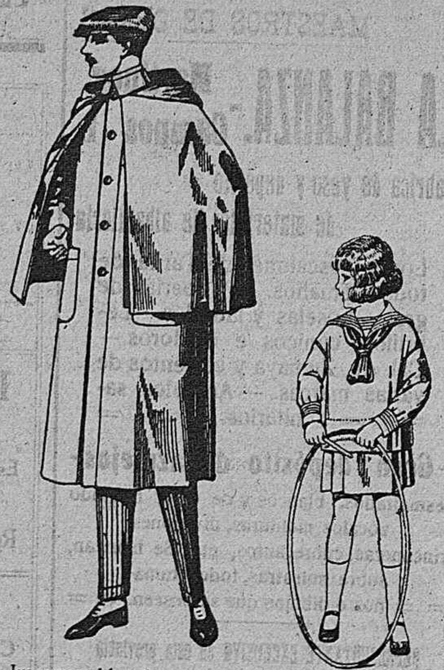
Impermeables forma «Macklerland», en negro y azul, de ptas. 65 a 150