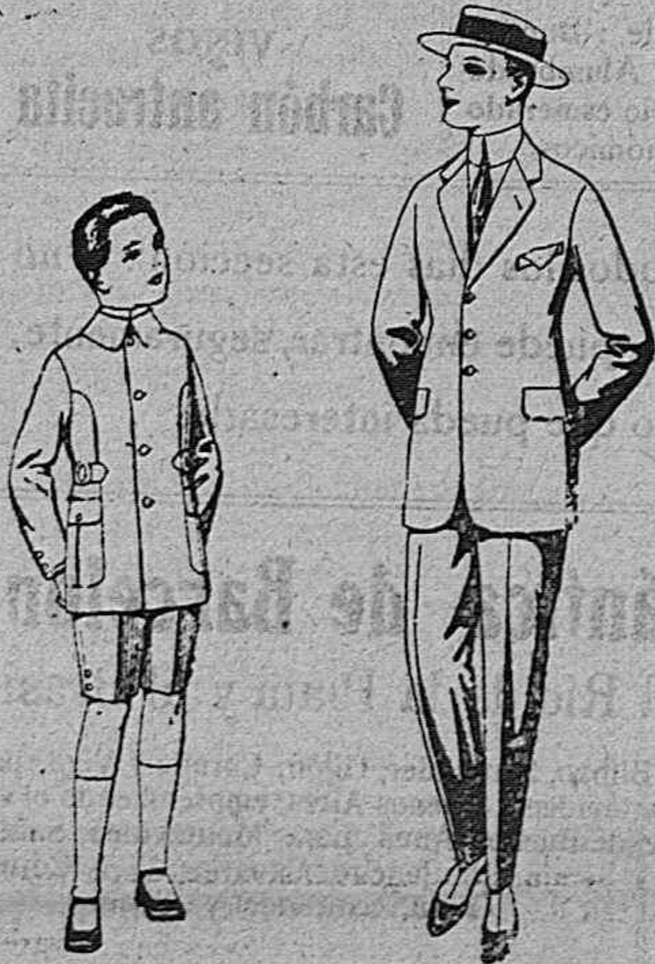
Trajes modelo Sport, de lanilla, estambre, melton, etc., para niños de 4 a 9 años, de ptas. 25 a 48