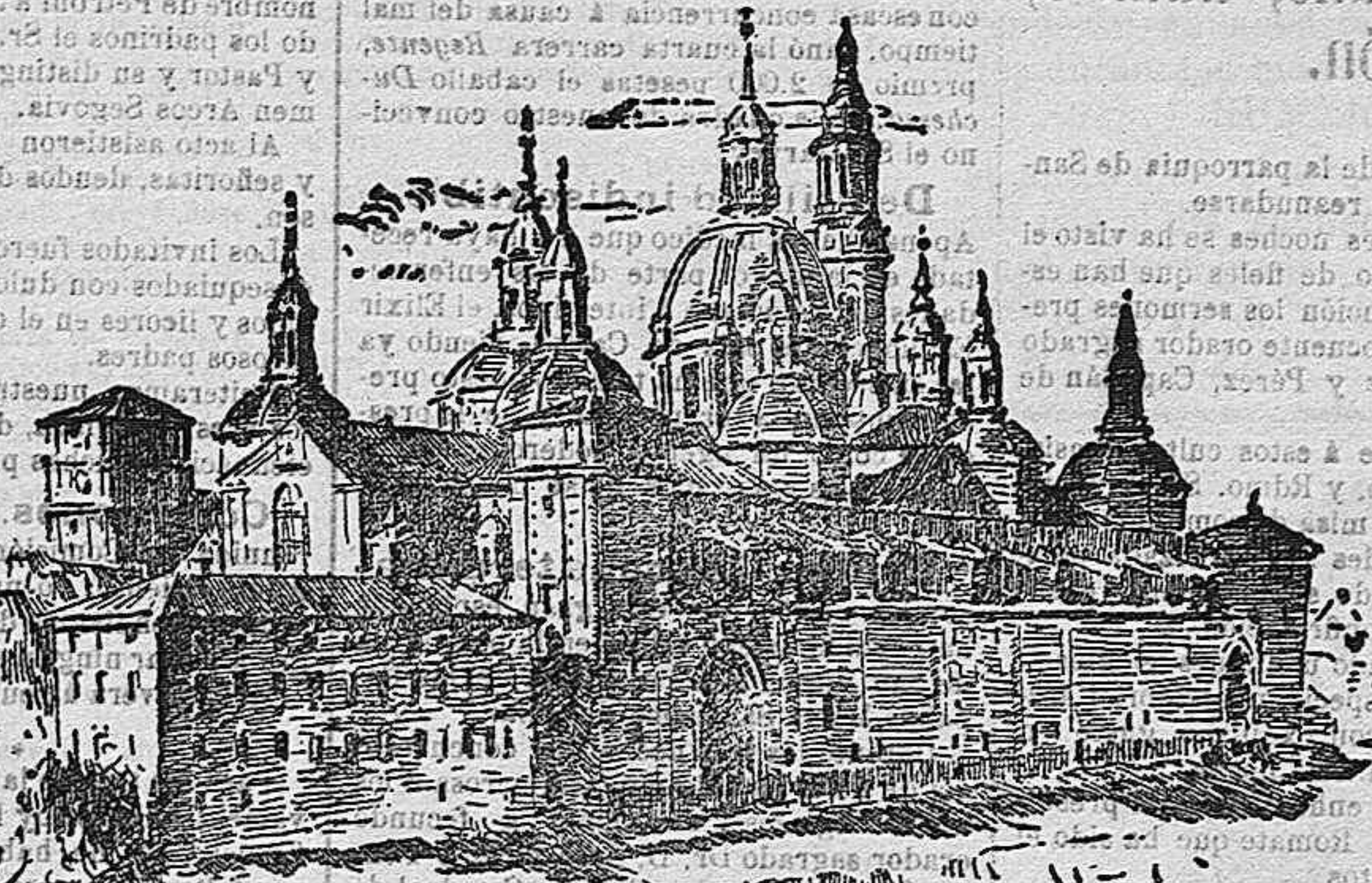
Basilica de Nuestra Señora del Pilar.

el transeúnte la ancha y lujosa vía, aparece ante sus ojos, grande, inmensa, coronada de cúpulas y cupulines, sin afiligranados adornos arquitectónicos, pero imponente con esa severa magestosidad que pudiera soñar el amor infinito, la fe inquebrantable que los aragoneses tienen en su Virgen, al idear el templo que había de ser la casa de la Madre de Dios.