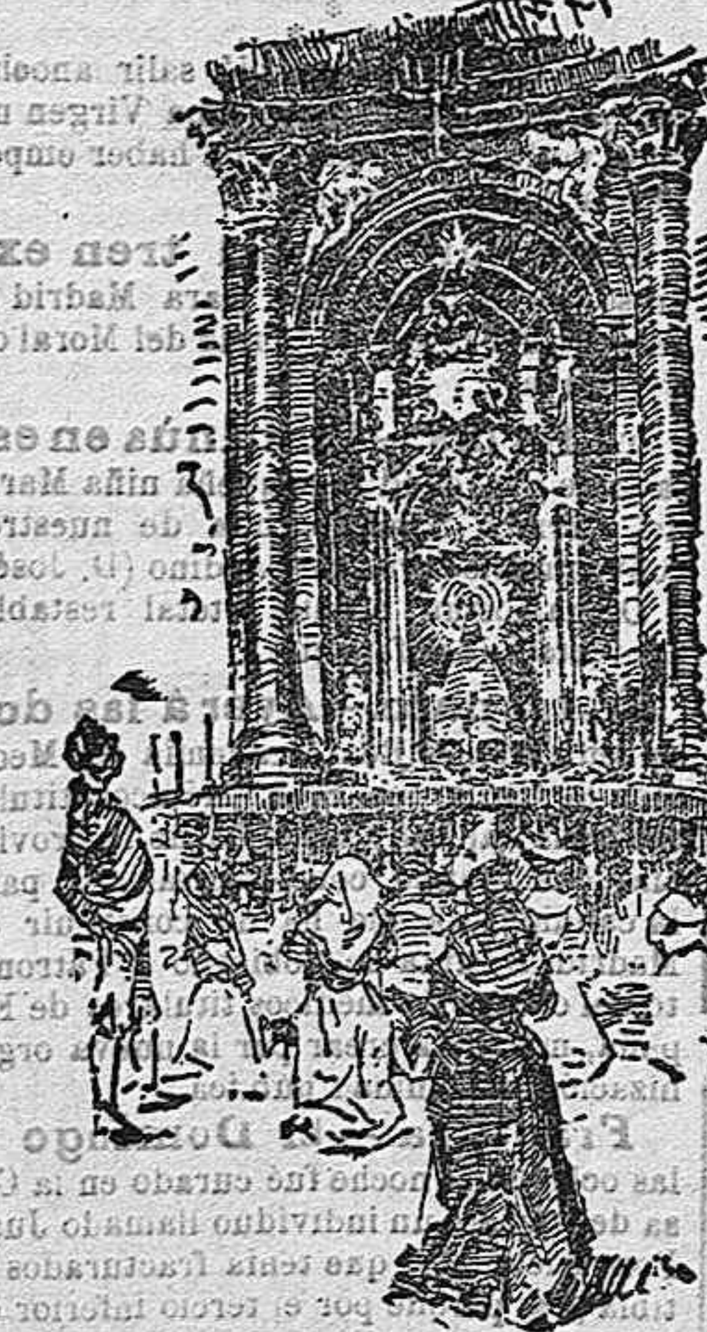
Capilla de Nuestra Señora del Pilar.

acuden a la capilla de la Virgen, donde su devoción pura y sencilla recita sentidas oraciones, arroja al interior de la verja puñados de monedas, enciende por sus propias manos velas que aumentan los resplandores en que se halla inundada la capilla, pone en manos de los infantiles de roja sotana y blanco ropón, piños de corta edad, para que los eleven hasta los pies de la Virgen y la adoren.