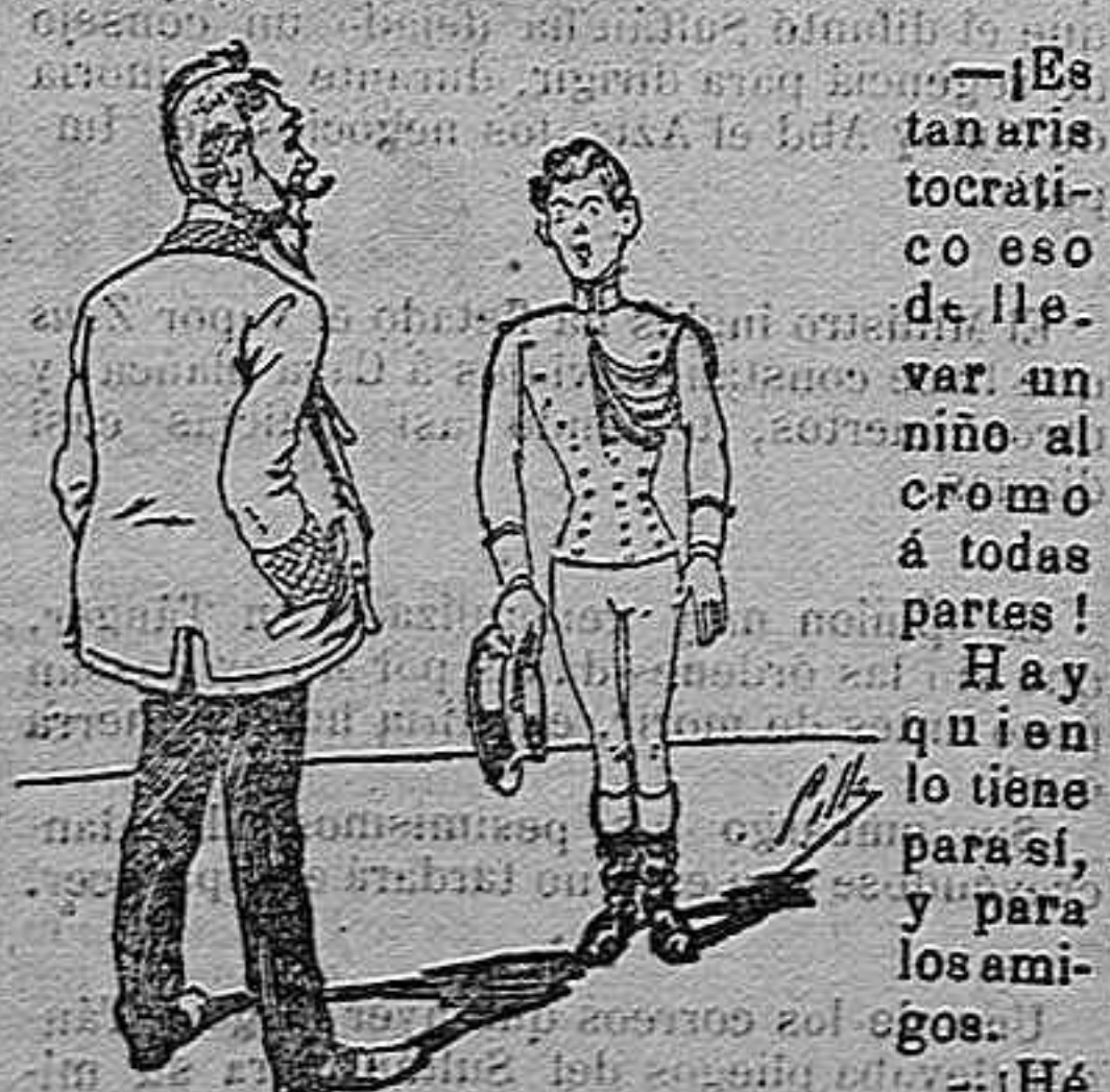
EDUARDO DE PALACIO.