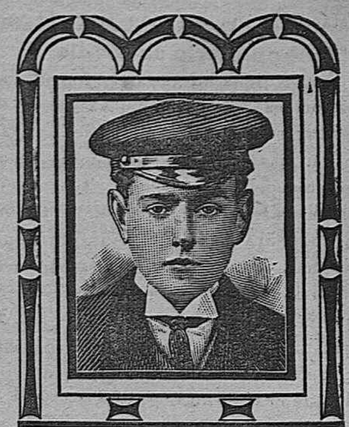
Barcelona, 11 Abril 1908. CALLE CONDE ASALTO NO. 42.

Para el próximo 28, día de Inocentes, se prepara una divertidísima función con programa altamente cómico.