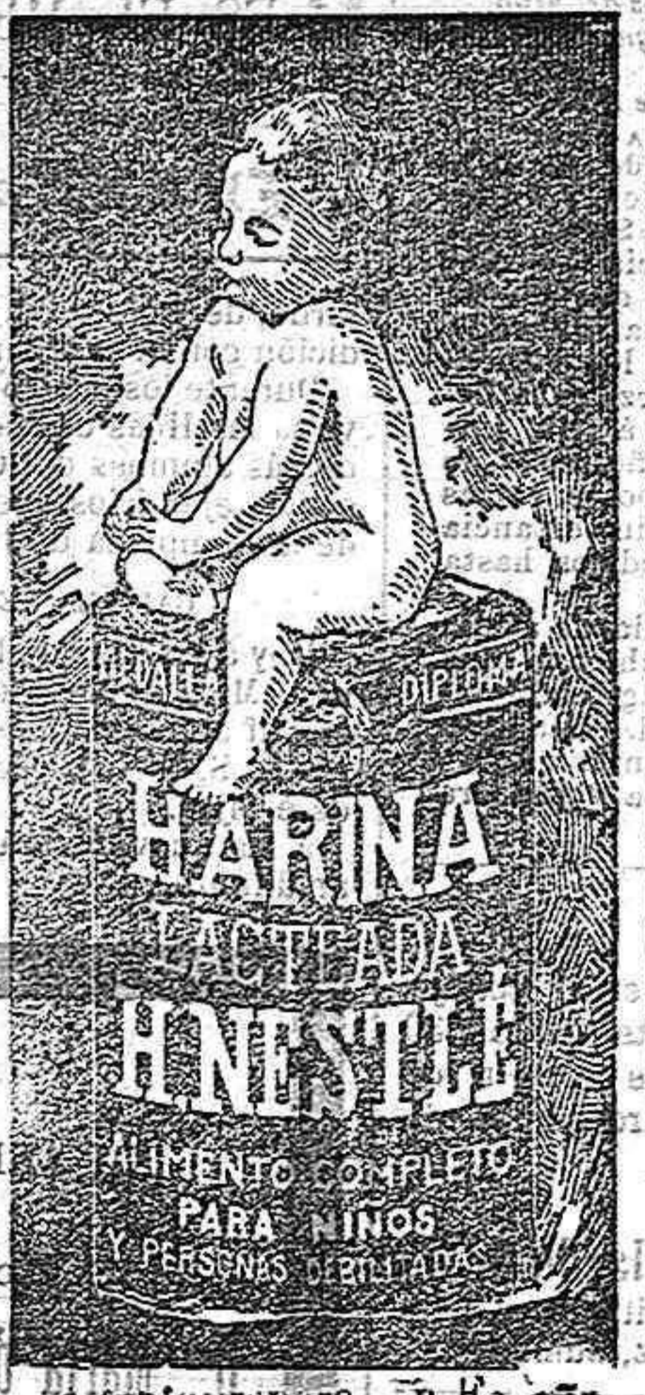
Agente general En Es.aña, J. U. UACH y C.ª, Moncaja 20, Barcelona

PILDORAS Y JARABE de BLANCARD con Ioduro de Hierro inalterable. CONTRA la Anemia, la Pobreza de la Sangre, la Opilacion, la Escrófula, etc.