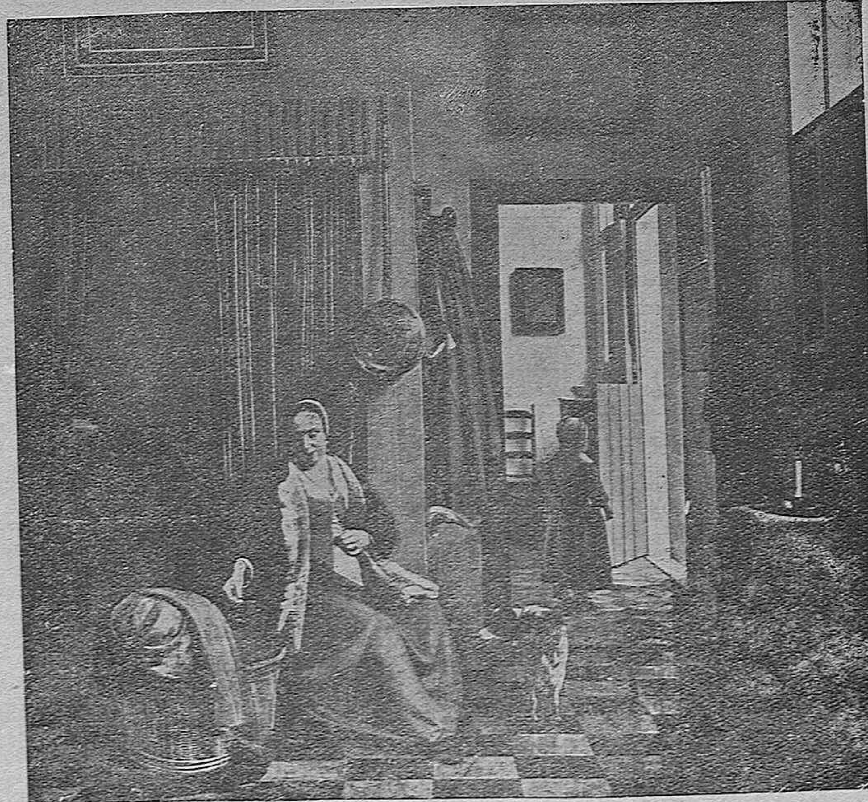
Pictet de Hook (1629) Galería Real de Berlín. He aquí uno de los más típicos interiores en que los pintores holandeses fueron maestros soberanos, con sus viviendas limpias y cómodas, su luz esplendorosa y una sensación de realidad admirable en la representación de la pacífica y laboriosa vida del hogar.