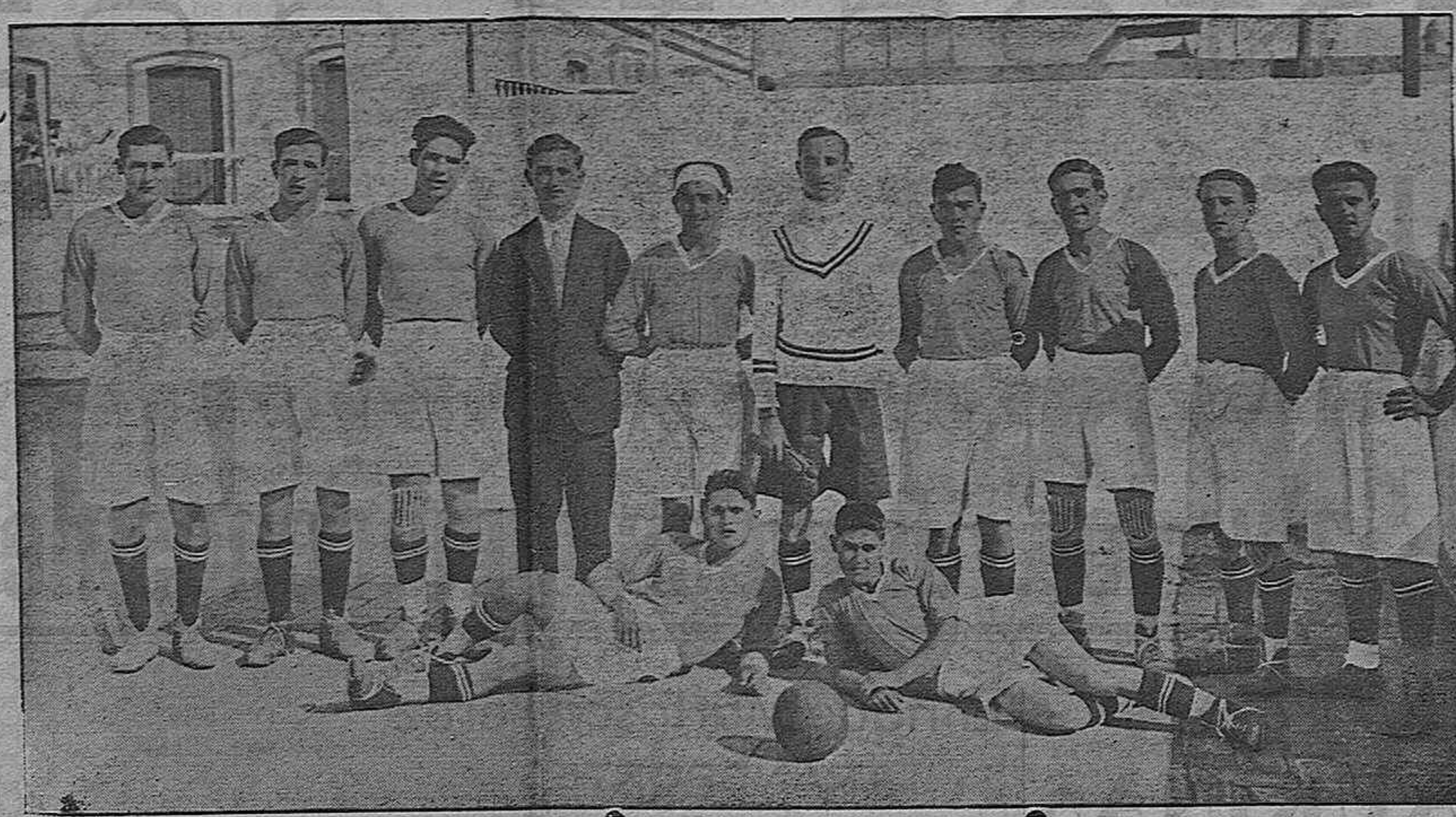
El equipo gaditano Aurora F. C. que el pasado domingo venció al Gimnástica F. C. por 2 a 1

presenta un gran surtido en relojes pulsera y bolsillo de las marcas más acreditadas, siendo sus precios baratísimos y garantizándose los relojes nuevos y de copomsturas, por un gran relojero procedente de América PRIM, 3.—CADIZ