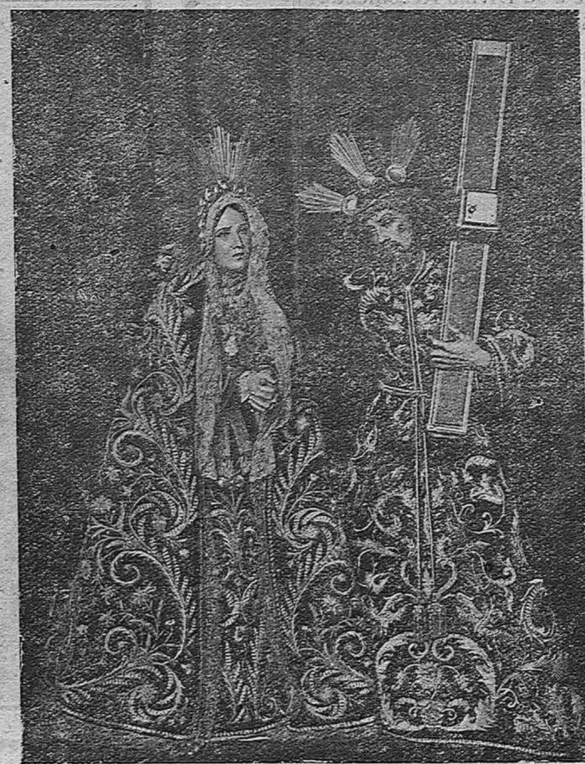
Ntro. Padre Jesús de los Afligidos y María Santísima de los Dolores