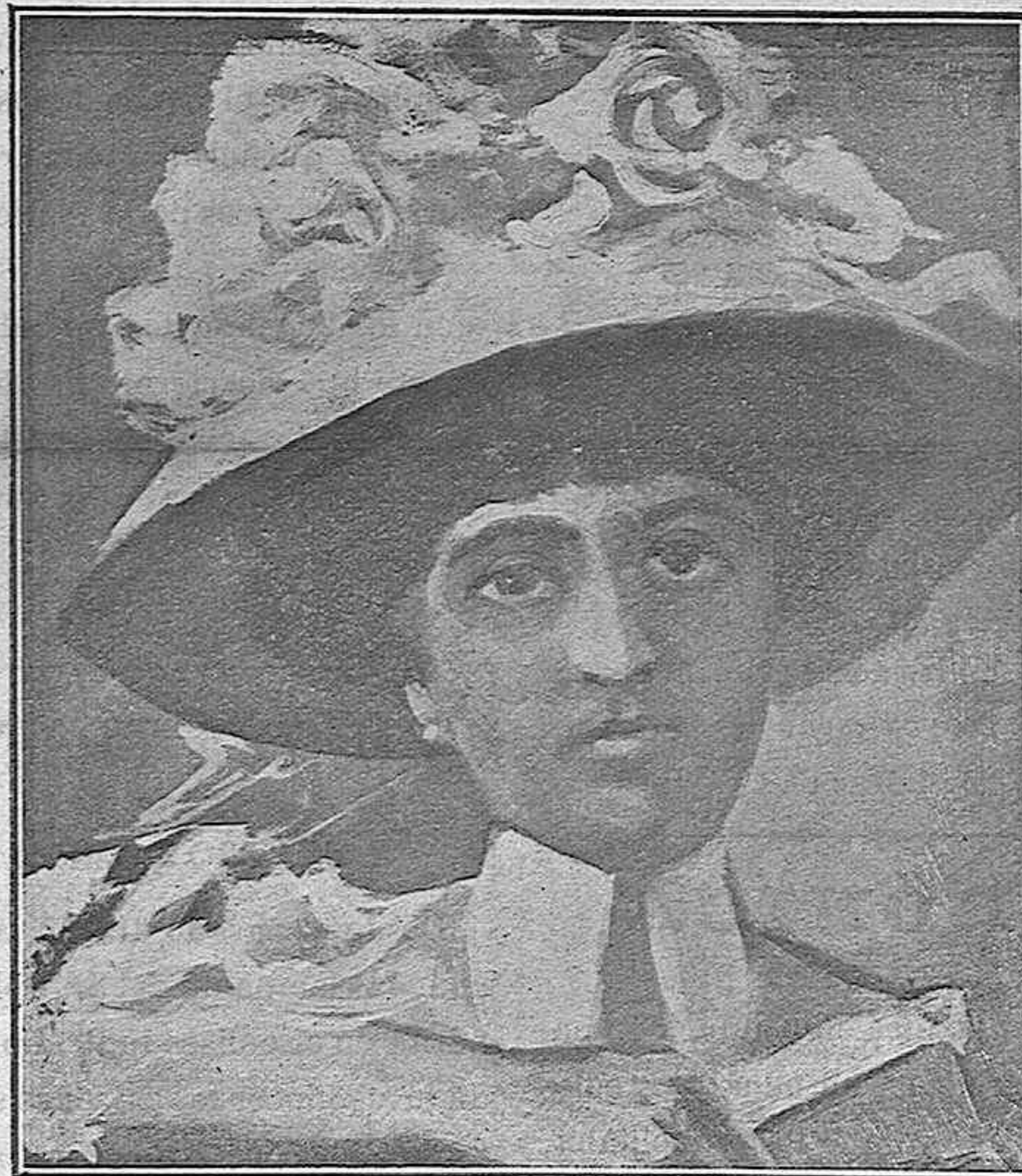
Hecho expresamente para la portada del libro Las de quiero y no puedo , recientemente publicado.

y los indiferentes, el cometa original observado en el cielo; para los que tienen hambre y sed de momios , el político.