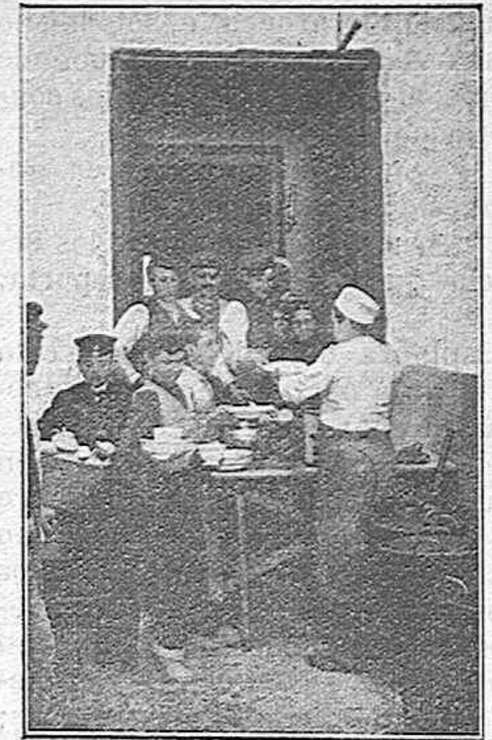
Distribución de la comida.

Establecimiento de Mercería, Juguetes, Artículos para Sombreros