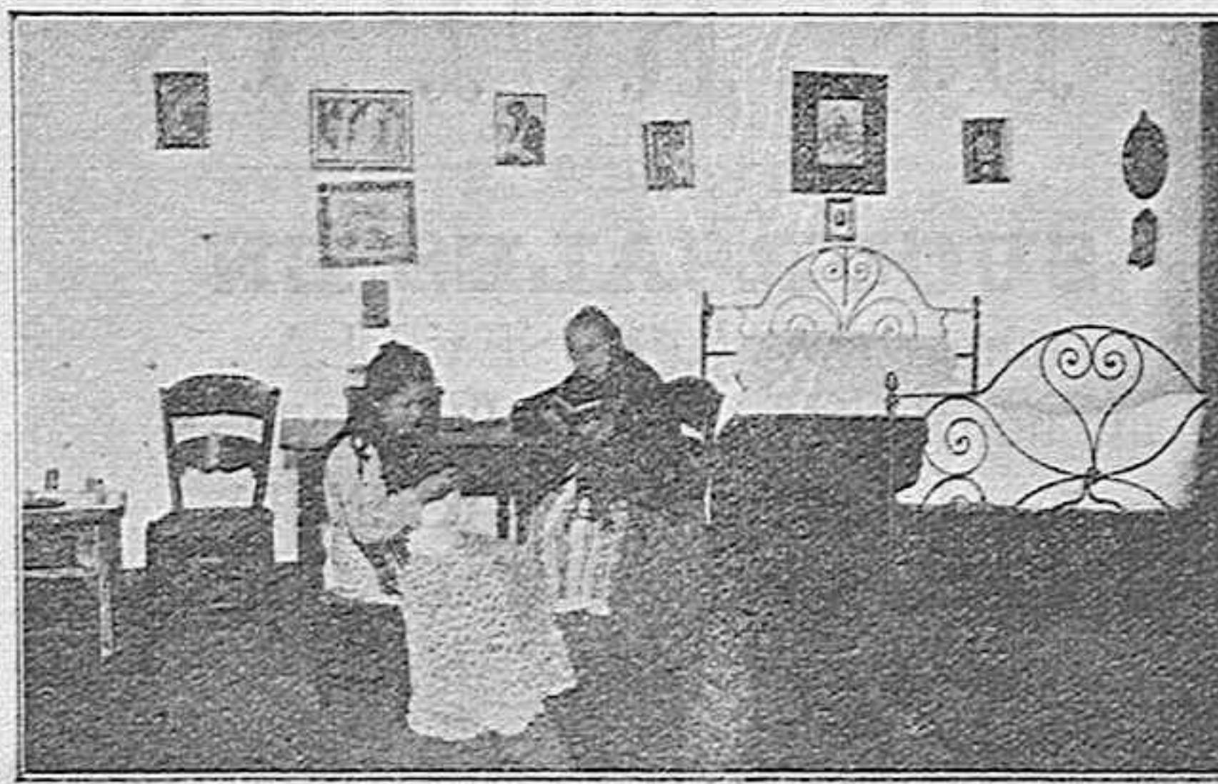
Interior de una habitación.

—No te extrañe lo que veas: es lo único, de quien, con pequeñas variantes, todo el mundo había bien; es lo único que existe en la tierra que pueda resaltar hermoso para todo el que lo vea, ¡aun para la persona más exigente! ¡es La Caridad! —BUENAVENTURA L. VIDAL.