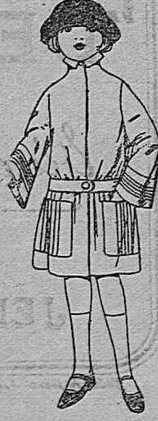
Abrigos de terciopelo de lana, gabardina, en azul y color, para niñas de 4 a 9 años. De ptas. 30 a 50.