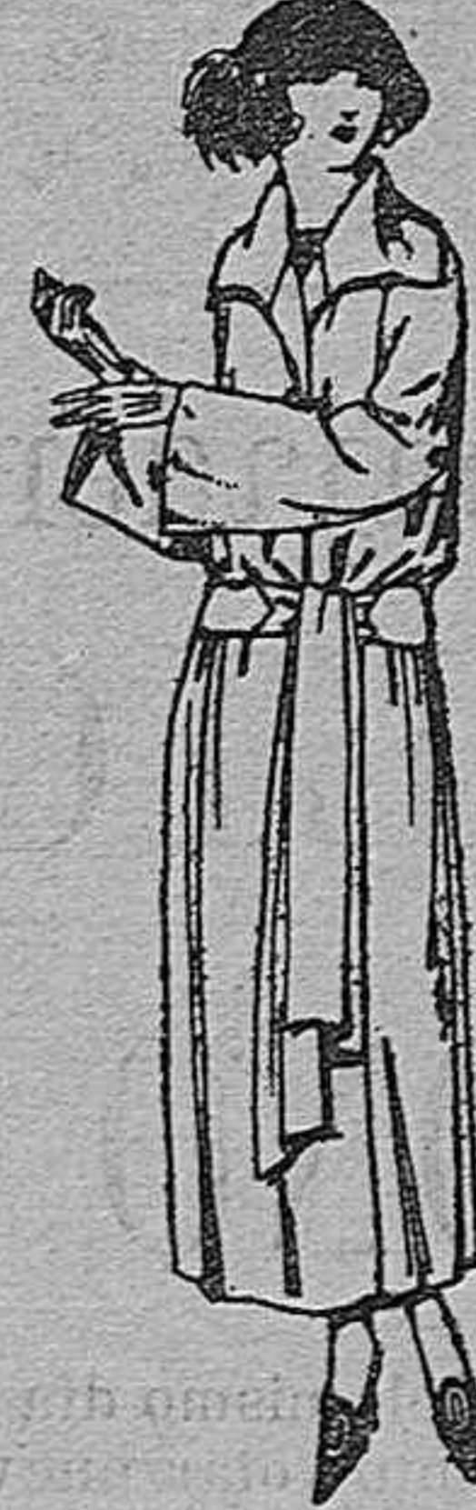
Abrigos de cheviot, gabardina, ratina, etc., en negro, azul y color. De ptas. 50 a 75.