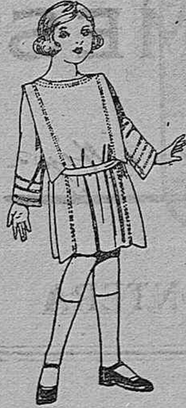
Vestidos de sarga inglesa, popetina, etc., en azul y color, adorno, respuntes seda, para niñas de 4 a 9 años. De ptas. 35 a 42.