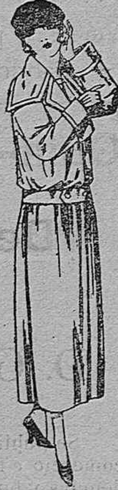
Guarda polvos de dril crudo, gris, etc. De ptas. 25 a 40.