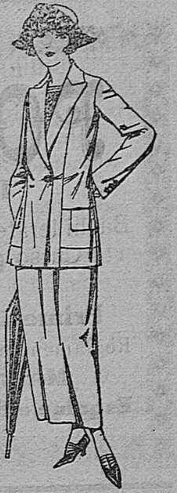
Trajes sastre, de sarga inglesa, satén estambre, etcétera; chaqueta forrada de seda, en negro, marino y colores moda. De ptas. 115 a 150