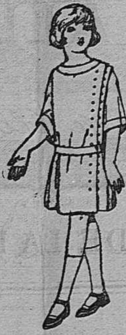
Vestidos de crepé de lana, en azul y color, para niñas de 4 a 9 años. De ptas. 30 a 40.