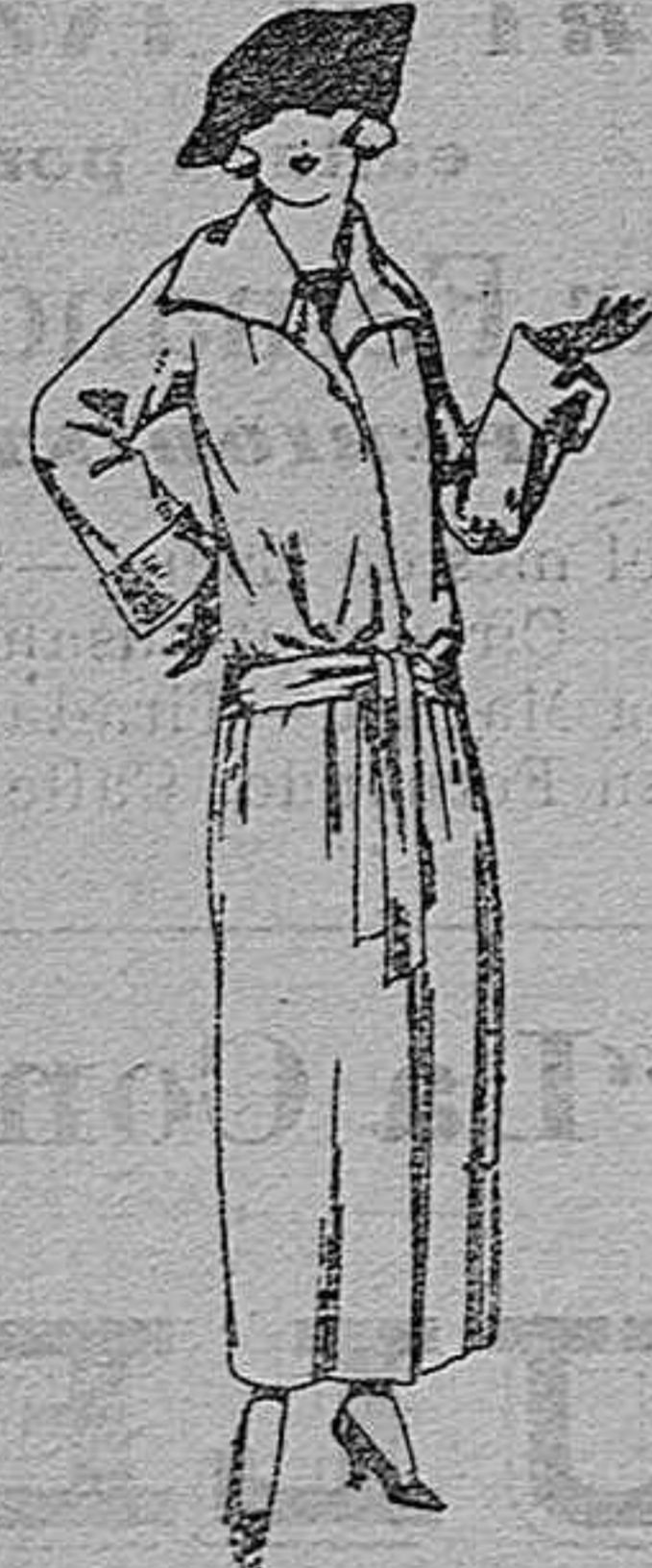
Guarda polvos de dril, satén, etc., colores moda. De ptas. 29 a 50