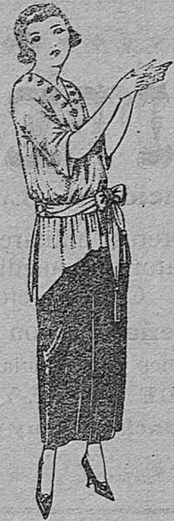
Paletots fie punto de seda, adornos bordados. De ptas. 47 a 120