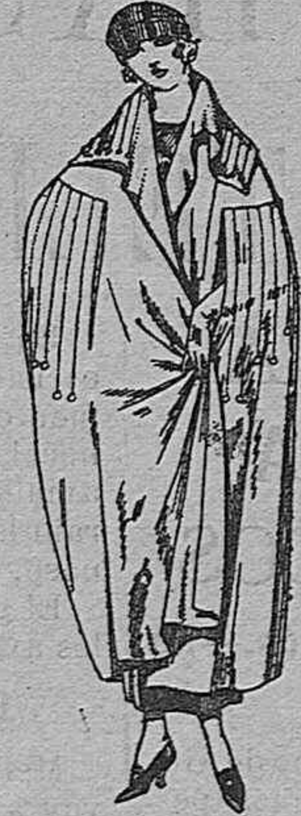
Capas de gabardina, pañete, etc., diferentes colores. De ptas. 85 a 125

Gorras, Sombreros, Cinturones, Calcetines, Corbatas, Pañuelos, Fajas, Ligas, Paraguas, Tirantes, etc., etc.