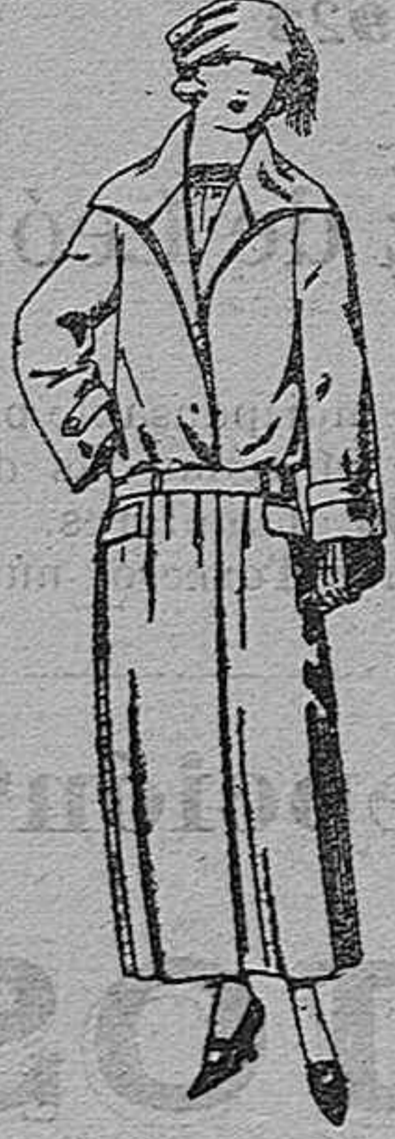
Abrigos de gabardina inglesa, impermeabilizada, en negro, azul y color. De ptas. 70 a 165.