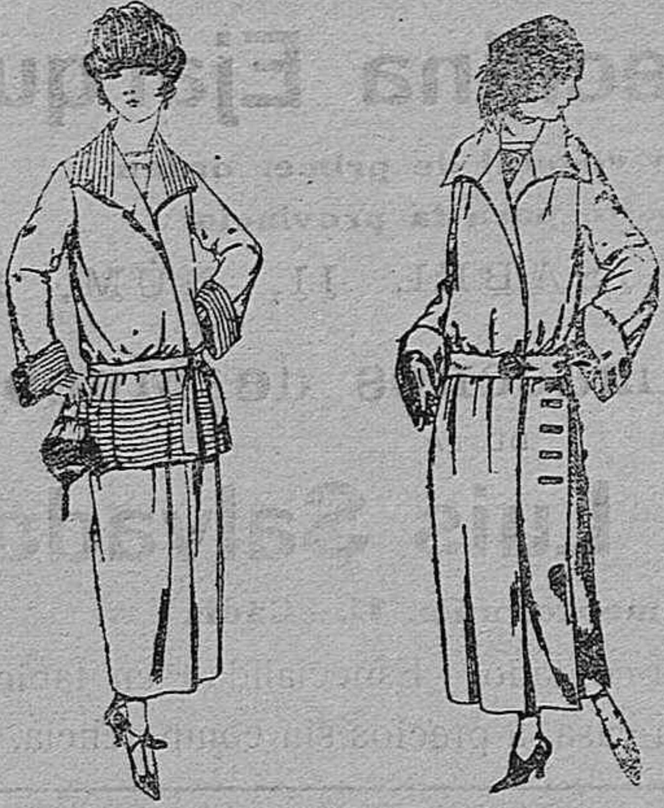
Trajes sastre, de sarga inglesa, cheviot, etc., adornos pliegues, chaqueta forrada de seda, en negro, azul y color. De ptas. 130 a 165.

Sucursales: Madrid, Barcelona, Alicante, Almería, Bilbao, Cádiz, Cartagena, Granada, Málaga, Palma de Mallorca, Santander, Sevilla, Valencia, Valladolid, Zaragoza