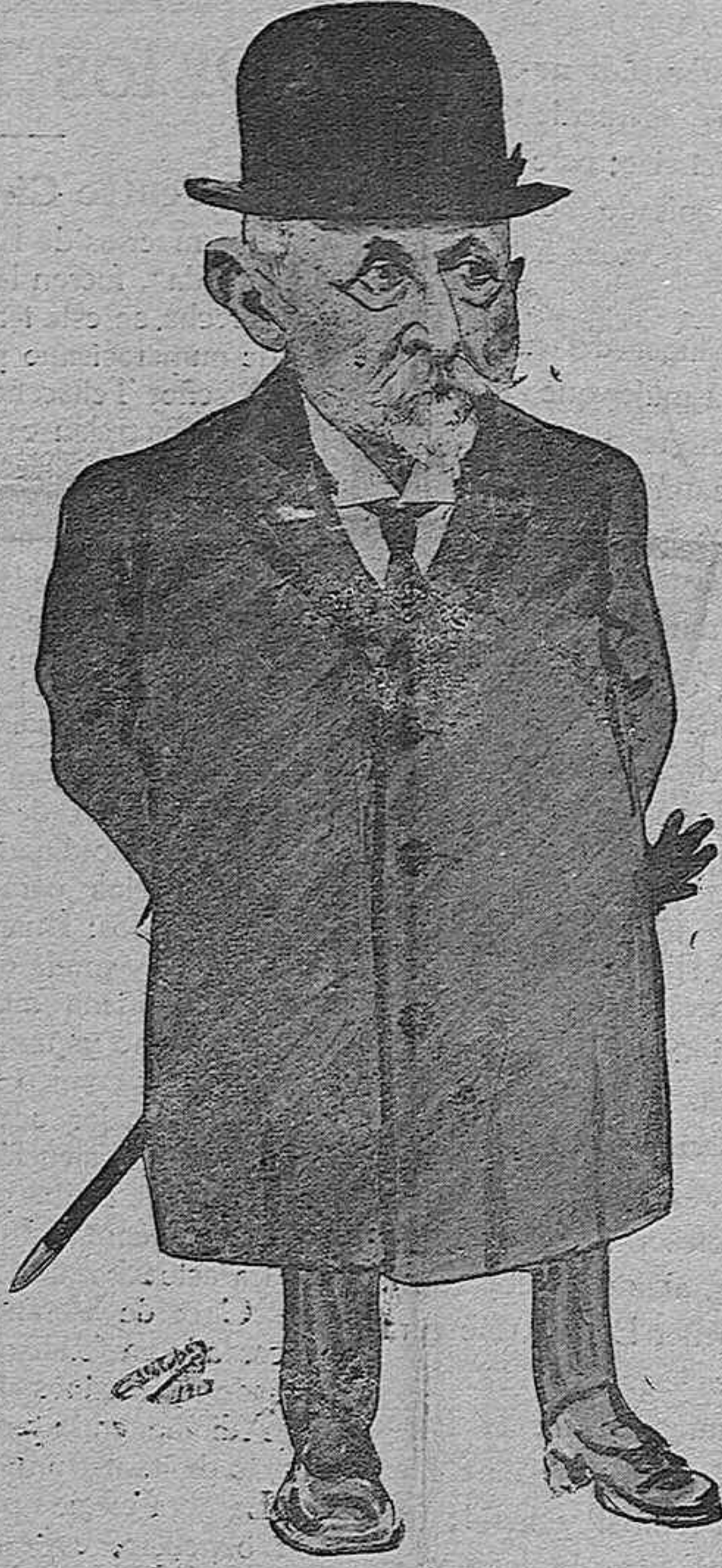
El caricaturista, ante la respetabilidad de don... ha detectado todos los rasgos grotescos.