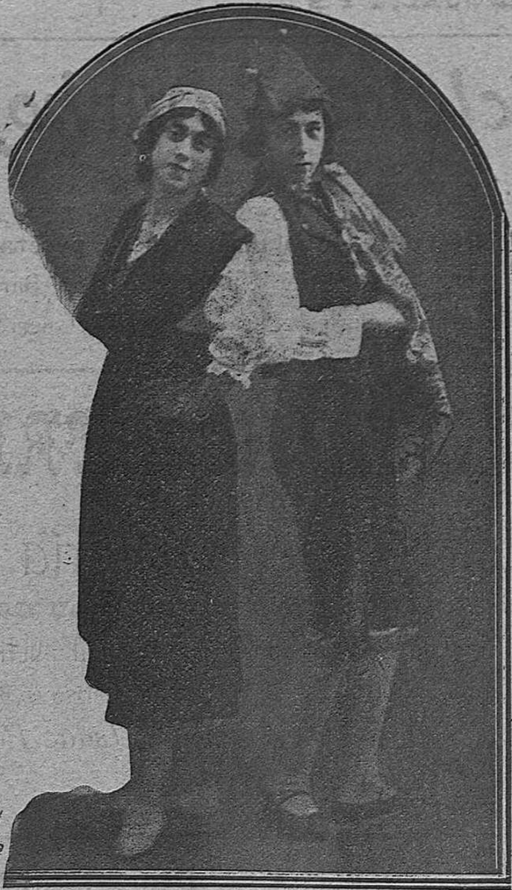
LAS MARQUESITAS, aplaudidas bailarinas.